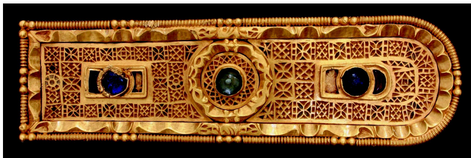
Slika 1: Avarski pojas (detalji), VII vek, nelegalno iskopan na lokalitetu Sirmijum

gradu iz 1997. godine, njegova tržišna vrednost iznosila bi oko milion evra. Avarski pojas je otkriven zahvaljujući sukobu oko pojasa dve dilerske mreže koje su želele da nelegalno dođu u njegov posed. Odeljenje za suzbijanje organizovanog kriminala MUP RS uhapsilo je glavnog učesnika i saučesnike, protiv kojih su podnete krivične prijave za krivična dela nelegalne trgovine, utaje i neovlašćenog izvođenja arheoloških radova 8 . Sudski proces završio se osudom na po tri godine uslovne kazne za svakog od njih.