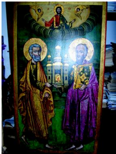
Slika 2: Prestone ikone sa ikonostasa crkve sv. Nikole u Sibaču 9