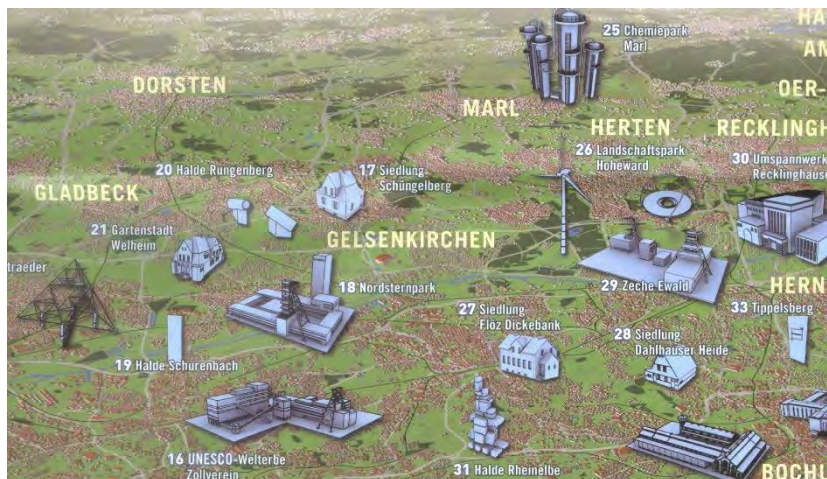
Slika 2. Ruta industrijske baštine oblasti Rur u Njemačkoj („Industrial Heritage Trail“/Route „Industriekultur“)

Na osnovni pravac staze priključuje se 25 'kuka'/'ankera'/akcenata (Anchor Point), na kojima posjetioci mogu, pored direktnog uvida u građenu industrijsku strukturu, da se neposredno upoznaju i sa specijalnim postrojenjima i procesima; zatim, 16 vidikovaca za panoramsko sagledavanje industrijskog pejzaža i 13 privlačnih naselja iz različitih razdoblja (slika 2). [11: 8] Pored osnovne, osmišljena je i „Ruta industrijske baštine biciklom“ („Industrial Heritage Trail by Bike“/ Route der Industriekultur per Rad ) – 700 km duga mreža biciklističkih staza, za alternativno otkrivanje industrijske prošlosti Rurskog regiona (Ruhr Metropolis).