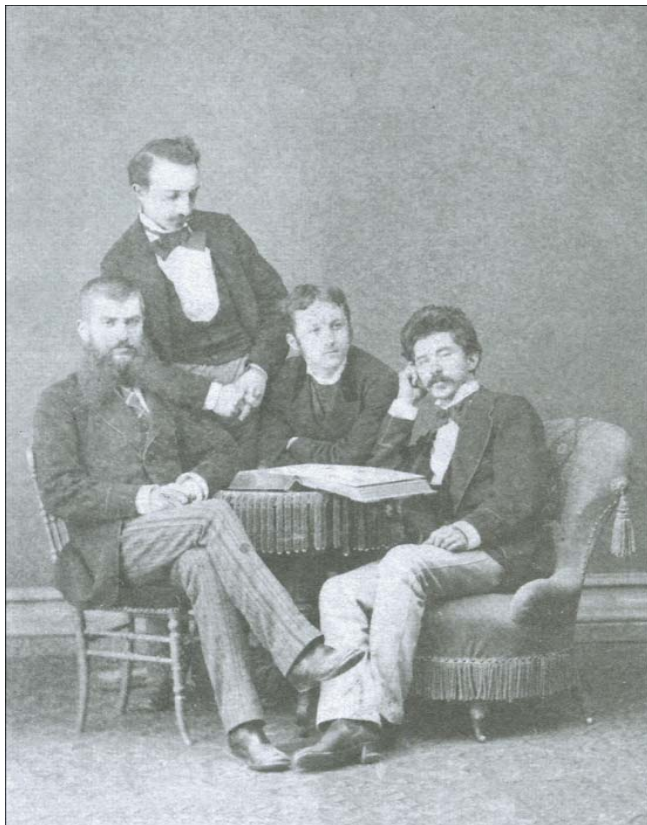
Милан Јовановић Батут (седи слева) и Лаза Костић (седи здесна) са колегама медицинарима у Бечу, 1872. године.