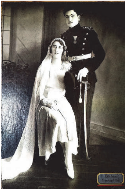
Gradski mladenci– илустр. 4.

Ступање у брачну заједницу (био) је прецизно организован друштвени чин јер је „...брак (је) могао бити склопљен само у оквиру важећих традицијских правила чије је поштовање било услов свих потоњих припремних свадбених радњи. Према овим правилима, до брака је могло доћи само између лица која нису била у крвном или вештачком ритуалном својству. 12 Свадбено весеље бележе фотографије и разгледнице које сведоче о традицији организовања ових друштвених догађаја. На разгледници „из архива Николе А. Косића” (Editions Francophiles, бр. 259), налазе се Gradski mladenci из Ужица, а брачни пар овековечен је 1929. године. Наслов јединице библиотечке грађе, димензија 15 x 11 cm, истакнут је на реверсној страни примерка, а разгледница је израђена у црно-белој техници.