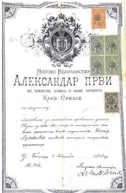
Указ краља Александра- илустр. 3