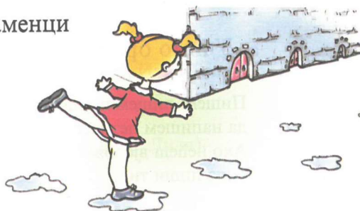
Слика бр. 1. (Васиљевић и др. 2001, стр. 6).

Енци, бенци на каменци. Троја врата запечата. Ери, кери, музикери. Кврц!