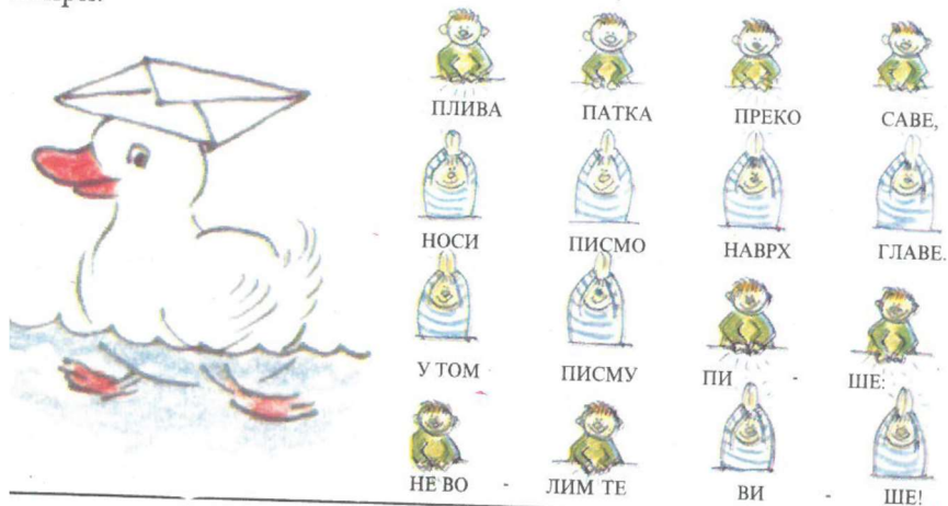
Слика бр. 2. (Васиљевић и др. 2013, 11).

Бројалица Ен ден дини може се користити за бројање на два или на етири. Додајемо још једну бројалицу која одговара бројању на етири: