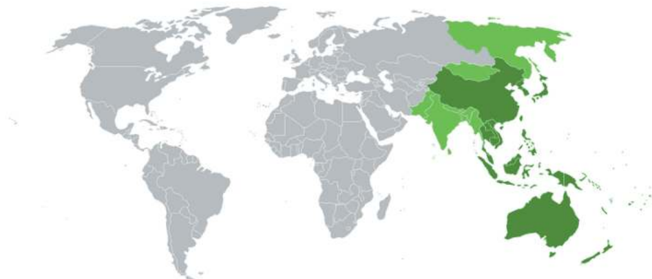
Slika br. 1. Zemlje u Azijsko-pacifičkom regionu u užem smislu-tamno zeleno: zemlje koje su uvek u regionu, svetlo zeleno: zemlje koje se često uključuju u sastav regiona

I pored činjenice da se na ovom prostoru nalazi više od 50 država savremenog sveta, jasno je da sve one nemaju podjednaki uticaj na odnose u Azijskom Pacifiku, što je pre svega povezano sa kapaciteteom moći kojim raspolažu. Nema dileme da SAD i Kina i njihovo spoljnopolitičko delovanje predstavljaju definišuće faktore Azijskog Pacifika, a njihovo nadmetanje i rivalitet je u osnovi narastajućeg konfliktnog potencijala regiona. U tom kontekstu, danas niko više ne osporava da najveću promenu u međunarodnoj politici, posebno u politici prema Azijskom Pacifiku, predstavlja meteorski uspon Kine i njena sve uočljivija namera da vodi globalnu politiku. Nijedna druga zemlja, kako zaključuje Kejgan, nije brže prešla put od slabosti do snage, (Kejgan, 2009), zbog čega će u godinama koje dolaze SAD sve teže moći da zadrže svoju izuzetnu ulogu u svetu (Bremer, 2006).