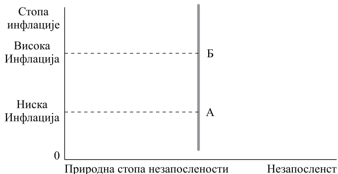
Слика 2. Дугорочна Филипсова крива 11

Када Централна банка повећа понуду новца, стопа инфлације се повећава, али незапосленост остаје на нивоу своје природне стопе на дуги рок.