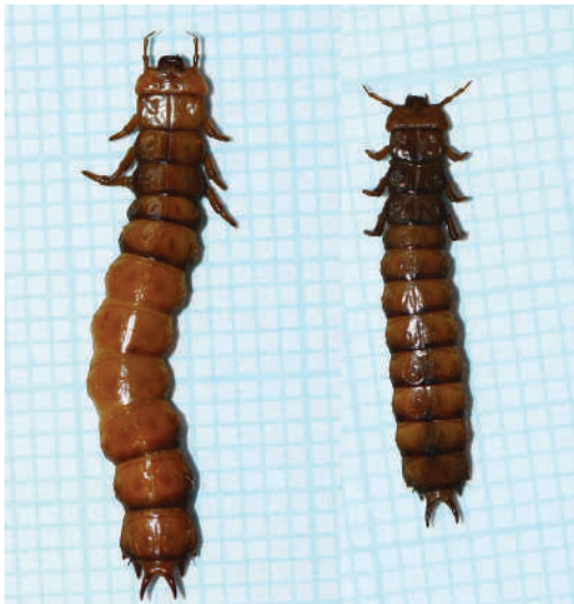
Slika 3. Larve vrste Cucujus cinnaberinus sa lokaliteta Hrčavka, Siljevice / Figure 3. Larvae of Cucujus cinnaberinus from Hrčavka, Siljevice site

Tokom naših istraživanja, larve ove vrste su pronađene najprije u 2015. godini ispod kore oborenih stabala bukve u kanjonima Jabušnice i Hrčavke (Slika 3) [ Lok. 8 : Hrčavka, gornji dio kanjona, Siljevice (leg. et det.: D.Kulijer; 25.06.2015.); Lok. 20 : Jabušnica, iznad sastavaka (leg. et det.: D.Kulijer; 27.06.2015.)], a zatim i 2016. godine na još stojećem trulom bukovom deblu u neposrednoj blizini Crnog jezera na Zelengori [ Lok. 2 : Zelengora, okolina Crnog jezera (leg. et det.: D.Kulijer; 30.07.2016.)].