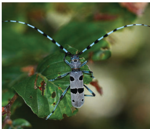
Slika 2. Rosalia alpina (ženka) sa lokaliteta Bukovi hrt / Figure 2. Rosalia alpina (female) from Bukovi hrt site

Alpska strizibuba naseljava pretežno planinska područja srednje i južne Evrope, jug Skandinavije i dijelove istočne Evrope. Larve se razvijaju u starim stablima, prije svega bukve, ali mogu živjeti i u drugim vrstama listopadnog drveća (Cizek et al., 2009). U BiH je ova vrsta široko rasprostranjena, posebno u područjima pokrivenim bukovim šumama (Drešković et al., 2011). Na teritoriji Nacionalnog parka „Sutjeska“ i šireg područja planine Zelengore ova vrsta je poznata iz prašume Perućice ( Lok. 14 ) (Georgijević & Luteršek, 1966; Georgijević 1976), i sa Tjentišta ( Lok. 6 ) (zbirke Zemaljskog muzeja BiH). Pored toga Georgijević & Luteršek (1966) i Georgijević (1976) navode podatak za područje Mratinja u graničnoj oblasti BiH i Crne Gore. Tokom naših terenskih istraživanja, R. alpina je pronađena na sljedećim lokalitetima: Lok. 5: Tjentište, naselje (leg. et det.: D.Kulijer; 03.07.2015.); Lok. 9: Bukovi hrt, put ka Orlovačkom jezeru (leg. et det.: D.Kulijer; 31.07.2016.) (Slika 2); Lok. 15: okolina jezera Donje bare (leg. et det.: I.Miljević; 14.07.2015.); Lok. 16: Zelengora, Previjski Pašin brijeg (leg. et det.: D.Kulijer; 15.07.2015.); Lok. 19: kanjon rijeke Sutjeske, Ninkovići (leg. et det.: D.Kulijer; 02.07.2015.).