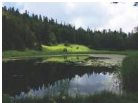
Slika 5. Crno jezero / Figure 5. Crno jezero Lake (30.07.2016)

Na planini Zelengori nalazi se devet planinskih jezera: Donje Bare, Gornje Bare (Slika 4), Orlovačko (Borilovačko) jezero, Jugovo (Borilovačko) jezero, Štirinsko jezero, Koblaničko jezero, Crno jezero (Slika 5), Bijelo jezero i Kladopoljsko (Orlovačko)