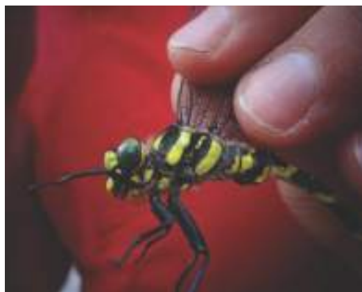
Slika 10. Mužjak velikog potočara ( Cordulegaster heros ) uhvaćen u ornitološku mrežu iznad rijeke Sutjeske / Figure 10. Male of Balkan Goldenring ( Cordulegaster heros ) caught in ornitological net spread above the Sutjeska river

Cordulegaster heros je endemična vrsta jugoistočne Evrope, rasprostranjena između Italije i Austrije na zapadu, Češke i Slovačke na sjeveru, Rumunije i Moldavije na sjeveroistoku i Grčke na jugu (Boudot & Kalkman, 2015). Naseljava zasjenjene potoke i rječice pješčanog dna, djelimično pokrivenog sitnim pijeskom i organskim substratom. Za opstanak ove vrste potrebna je očuvanost šumskih staništa, kao i čista tekuća voda bogata kiseonikom (Boudot & Kalkman, 2015). U Bosni i Hercegovini je C. heros prvi put registrovan 2007. godine (Kulijer et al., 2013). Nakon toga su populacije ove vrste pronađene širom zemlje, posebno u južnom i sjevernom dijelu, dok je u planinskom području znatno rjeđa (Kulijer et al., 2012, 2013, 2016). Jedini primjerak ove vrste registrovan tokom naših istraživanja je 30.06.2015. godine uhvaćen