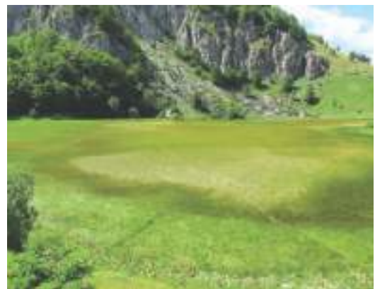
Slika 7. Jezerina na Gornjim Barama / Figure 7. Jezerina at Gornje Bare lake (14.07.2015)

močvarnom području je u 2014. i 2015. registrovano ukupno 14 vrsta, među kojima se posebno ističe C. hastulatum .