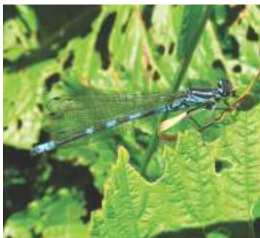
Slika 8. Mužjak planinskog plavca ( Coenagrion hastulatum ) / Figure 8. Male of Northern Damselfly ( Coenagrion hastulatum )

Coenagrion hastulatum (Slika 8) je evrosibirska vrsta rasprostranjena od istočnog Sibira do Srednje Evrope (Sternberg & Röhn, 1999). Južna granica Evropskog areala vrste ide preko južnih Alpa sa jugozapadnom disjunkcijom u Pirinejima i jugoistočnom na području Balkana (Bosna i Hercegovina, Bugarska, Crna Gora i Srbija) (Boudot et al., 2009; Bedjanič, 2011; Boudot & Kalkman, 2015).