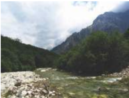
Slika 2. Rijeka Sutjeska / Figure 2. Sutjeska river (27.06.2015)