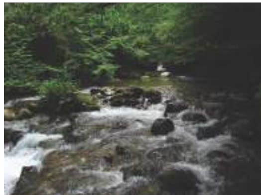
Slika 3. Donji tok rijeke Hrčavke / Figure 3. Lower reaches of the Hrčavka river (26.06.2015)