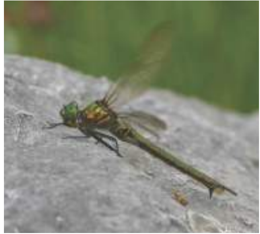
Slika 9. Ženka planinskog smaragda ( Somatochlora metallica ) / Figure 9. Female of Brilliant Emerald ( Somatochlora metallica )

U jugoistočnoj Evropi S. metallica (Slika 9) je veoma rijetka vrsta (Boudot & Kalkman, 2015). Njena distribucija na Balkanu je ograničena na staništa u visokoplaninskom području gdje naseljava isključivo planinska jezera, staništa koja su rijetka u ovom dijelu kontinenta (De Knijf et al., 2013). Visoke planine BiH, Bugarske i Crne Gore predstavljaju krajnju južnu granicu areala vrste, a populacija S. metallica na Zelengori su među najjužnijim u Evropi (Boudot & Kalkman, 2015).