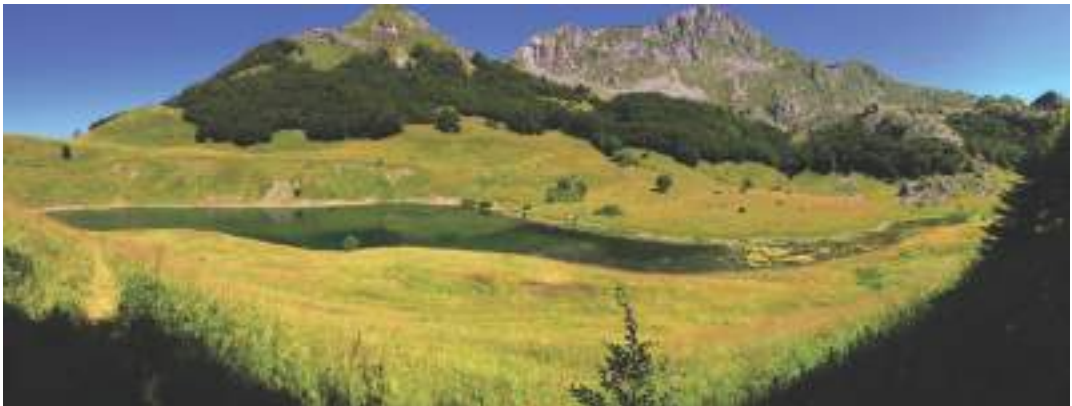
Slika 6. Orlovačko jezero / Figure 6. Orlovačko jezero lake (31.07.2016)