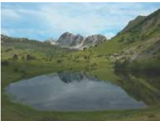
Slika 4. Gornje Bare jezero / Figure 4. Gornje Bare Lake (29.07.2016)