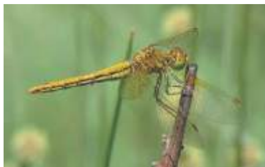
Slika 11. Ženka žutokrilog livadara ( Sympetrum flaveolum ) / Figure 11. Female of Yellow-winged Darter ( Sympetrum flaveolum )

Sympetrum flaveolum je relativno česta vrsta u BiH koja naseljava lokve, bare, tresetišta i vegetacijom obrasle margine jezera u planinskom