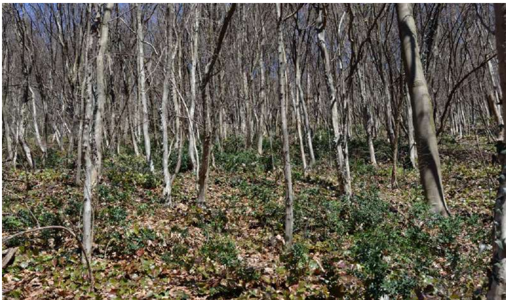
Slika 6. Stanišni tip Fraxinus ornus-Carpinus orientalis / Figure 6. Habitat type Fraxinus ornus-Carpinus orientalis

svega jer u nadstojnom spratu dominira Carpinus orientalis , koji formira jako gust sklop, sprečavajući dotok svjetlosti u podstojne etaže.