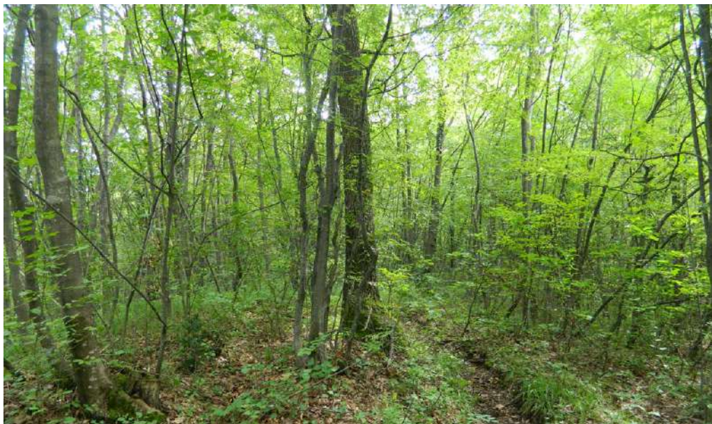
Slika 5. Stanišni tip Carpinus orientalis-Quercus petraea / Figure 5. Habitat type Carpinus orientalis-Quercus petraea

karaktera Cruciato glabrae-Carpinetum orientalis Šugar et Trinajstić ex Stupar et al. 2015. U ovoj zajednici se ne javlja mnogo vrsta, prije