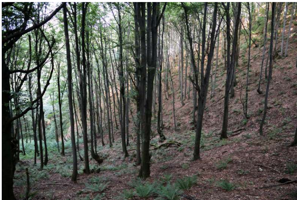
Slika 3. Stanišni tip Athyrium filix-femina-Fagus sylvatica / Figure 3. Habitat type Athyrium filix-femina-Fagus sylvatica

vrsta (Slika 3). Najveći udio u prizemnom spratu imaju mezoneutrofilne vrste: Rubus hirtus , Galium odoratum , Dryopteris filix-mas , Festuca drymeja , Lamiastrum galeobdolon , Artemisia agrimonoides .