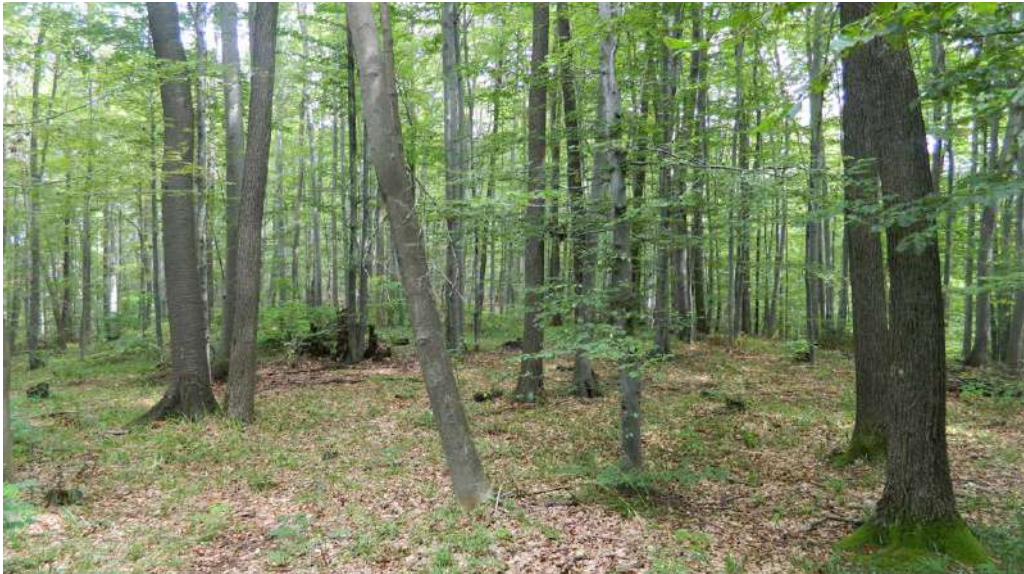
Slika 4. Stanišni tip Vaccinium myrtillus-Quercus petraea / Figure 4. Habitat type Vaccinium myrtillus-Quercus petraea