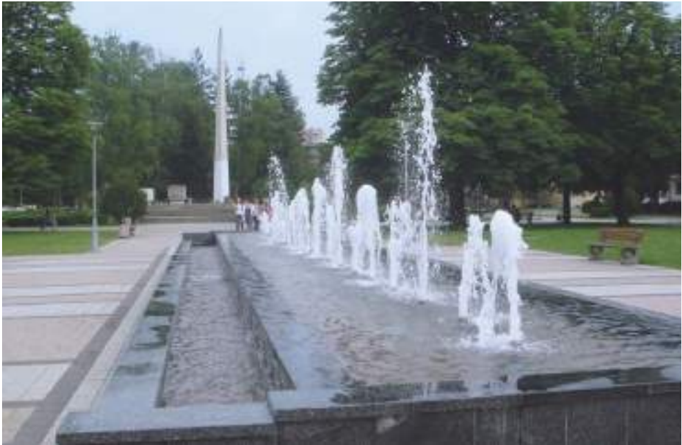
Слика 2. Поглед на обелиск Figure 2. View of the obelisk

Град Добој се налази у равничарско брежуљкастом предјелу на надморској висини од 150 m. Ријека Босна долази из правца југоистока гдје се пробија кроз узан кањон након чега наступа равничарки терен окружен брежуљцима и брдима. Надморска висина ових брда креће се до 350 m.