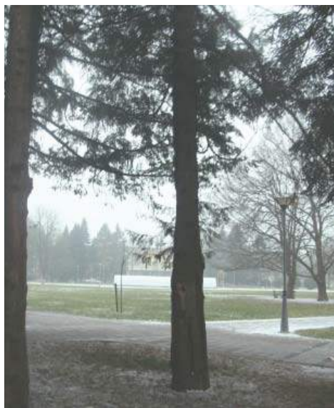
Слика 4. Оштећења на деблу ( Thuja gigantea ) Figure 4. Damages on the trunk ( Thuja gigantea )

Антропогенизовано земљиште које је настало усљед мјешања слојева земљишта, а као посљедица изградње инфраструктуре, није доброг састава и аерације, а претпоставља се да садржи и примјесе креча што се одражава на виталност појединих врста. Кад је у питању дрвеће, ово се најбоље очитује на таксонима: Aesculus hippocastanum , Paulownia tomentosa , Thuja gigantea који имају најмање оцјене виталности и декоративности и код којих је већи број примјерака потребно занјени здравим садним материјалом.