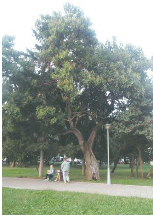
Слика 3. Стабло пауловније ( Paulownia tomentosa ) Figure 3. Princess tree ( Paulownia tomentosa )

Paulownia tomentosa (Thunb.) Steud. (Пауловнија) са два примјерка у парку дјелује веома инпозантно по димензијама и изгледу, међутим здравствено стање ове врсте је лоше (оцјене виталности и декоративности 1,5 и 3) што показују велика оштећења (шупљине и пукотине) изазвана механичким путем, а касније је улиједио и напад гљива које изазивају трулеж дебла (слика 3).