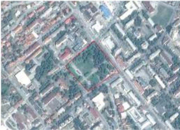
Слика 1. Положај Парка народних хероја у Добоју

Добојски градски парк (Парк народних хероја) се налази у самом центру града и поглед на парк је омогућен са свих страна парка (слика 1). Према класификацији зелених површина (Anastasijević 2007) спада у групу зелених површина опште намјене.