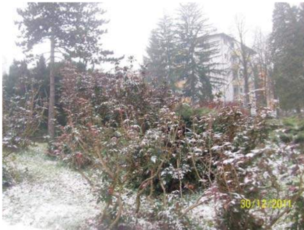
Слика 5: Група примјерака махоније ( Mahonia aquifolium )

Mahonia aquifolium (Pursh) Nutt. (Махонија) са евидентиране двије групе, а као што је и наведено у табели 6, је веома неугледна, тј. са закр-