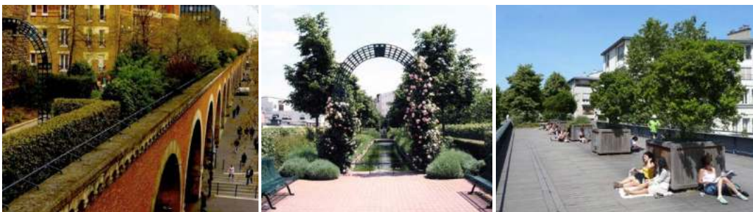
Slika 2. Promenada Plante u Parizu, Francuska / Figure 2. Promenade plantée in Paris, France.

Promenade plantée (Coulée verte) u Parizu (Slika 2). To je djelimično povišeni zeleni koridor dug 4,7 km, koji slijedi staru Vinsen željezničku liniju ugašenu 1969. godine. Izgradnja zelenog koridora završena je 1994. godine pod pokroviteljstvom Odjeljenja za parkove, vrtove i otvorene prostore grada Pariza. Regeneracija Promenade Plante, zajedno sa Viaduc des Arts i Jardin de Reuilly , dovela je do adaptacije napuštenih prostora i izgradnje novih stambenih i poslovnih zgrada. Prihodima od prodavnica ispod Viaduc des Arts isplaćuju se troškovi održavanja ovog parka (Trkulja, 2015), a vlada kupuje neku vrstu preventivnog osiguranja jer zeleni koridori smanjuju javne troškove zdravstvene zaštite povećanjem nivoa fizičke aktivnosti zajednice i obezbjeđuju kontrolu poplava (Little, 1990).