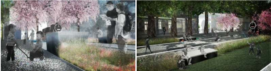
Slika 7. 3D modeli projektnog rješenja zelenog koridora / Figure 7. 3D models of landscape architecture project of greenway

a nove generacije bi stekle znanje i osjetile duh zaboravljene epohe u kojoj je željeznica značila život za grad Trebinje (Slika 7).