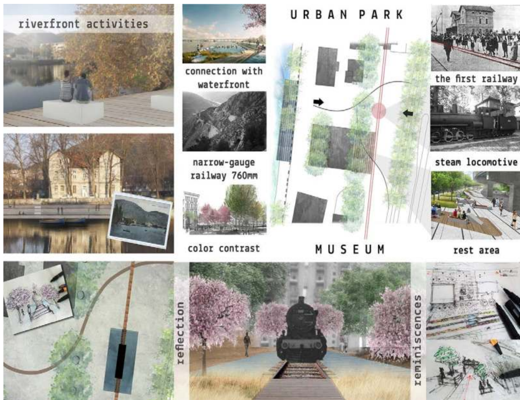
Slika 5. Koncept dizajn zelenog koridora / Figure 5. Conceptual design of greenway (© T. Marić)

Cilj koncepta dizajna zelenog koridora je postojećim željezničkim artefaktima, koji svjedoče o istoriji i duhu mjesta, dati nove funkcije te ih učiniti atraktivnim i prepoznatljivim. Obnovom i 'presvlačenjem' pruga, prenamjenom prizemlja stare stanice u muzej stvara se prostor koji svjedoči o istoriji željezničke stanice, a pri tome se dodatno obogaćuje interpolacijom nove zelene strukture sa postojećom, koja daje pečat čovjekomjernosti i prirodnosti (Slika 5).