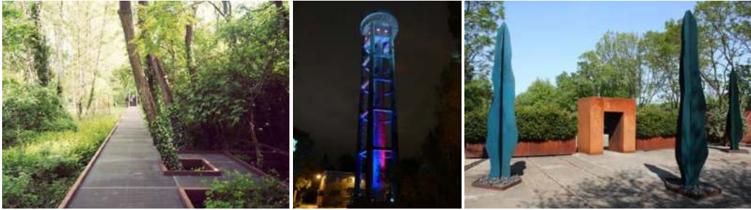
Slika 1. Park prirode Šeneberger Zidgelende u Berlinu, Njemačka / Figure 1. Natur-Park Schöneberger Südgelände in Berlin, Germany.

Ekonomske beneficije zelenih koridora odnose se na ekonomsku dobit kako pojedinaca tako i zajednice, jer povećavaju vrijednost obližnje nepokretne imovine, lokalne ekonomije i preduzeća, kao i državne i lokalne vlade. Dobit zajednice kao cjeline odnosi se na stvaranje novih tržišta unutar zajednice, iniciranih razvojem turizma i rekreacije na otvorenom. Povećan turizam i rekreacija na otvorenom stvaraju veću potražnju za sadržajima koji mogu imati značajan uticaj na lokalnu ekonomiju (npr. restorani, moteli, hoteli, iznajmljivanje rekreacione opreme i sl.).