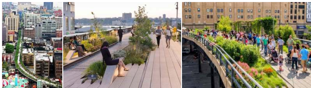
Slika 3. Haj Lajn povišeni urbani park u Njujorku, SAD / Figure 3. High Line elevated urban park in New York, USA.

marena i napuštena industrijska pruga, kojom je zadnji voz prošao 1980. godine, bila je zarasla u šibljie i postala “divlji” park. To je uticalo da se u velikom broju Njujorčana rodi ideja o njenoj transformaciji u zeleni koridor. Izgradnja zelenog koridora završena je 2014. godine. Regeneracija pruge, kao i izgradnja većih otvorenih prostora uz zeleni koridor i transformacija napuštenih skladišta i fabrika u umjetničke galerije, dizajn studija, trgovine, restorane, muzeje, stambene zgrade, noćne klubove, butike i druge raznovrsne funkcije, dovela je do urbanizacije prostora, porasta cijene zemljišta i nekretnina. Takođe, sa dva miliona posjetilaca godišnje Haj Lajn predstavlja uzoran zeleni koridor za finansije, planiranje i dizajn (Trkulja, 2015).