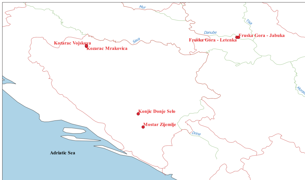
Slika 1. Karta istraživanih populacija / Figure 1. Map of investigated populations