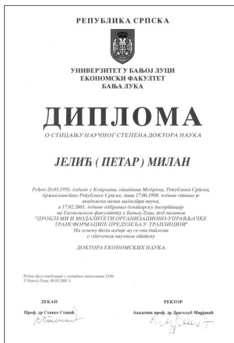
М РС БЛ, Збирка за историју Републике Српске, Диплома о стицању научног степена доктора наука, инвентарни број 218