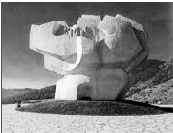
Бошко Кућански: Споменик на Макљену

"Мобил" Бошка Кућанског је резултат димензионалног обликовно-градитељског искуства у типу скулптуре зване објекат. Можда "Караван" из 1970. године и оваква дјела Бошка Кућанског вуку далеке асоцијације на крило птице, неку изумрлу животињску врсту, рибу, птицу, или су они неки заборављени употребни предмети осовремене приче испричане длијетом.