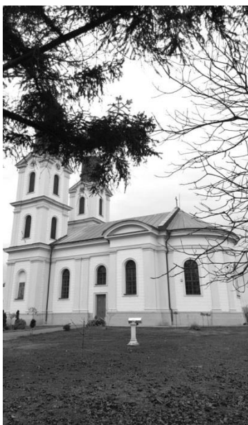
Слика 5. Јужна фасада

Проширењем западног, предолтарског травеја у простор пјевница, сјеверна и јужна подужна фасада добиле су ванредно добро димензионисане истакне завршене сегментно обликованим тимпаноном, што је све важан фактор атрактивности ових фасада и успјеле ритмизације изузетно добро одмјерених односа конститутивних волумена грађевине.