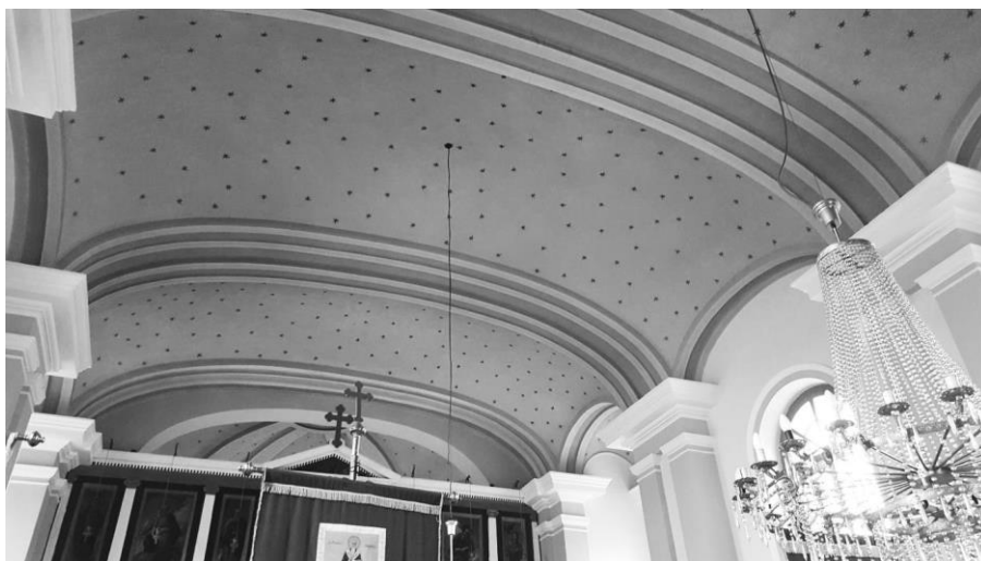
Слика 4. Ентеријер цркве с погледом на подужни свод и ојачавајуће попречне лукове ослоњене на пиластре

Црква је репрезентативно здање, у основи лонгитудинално усмјерена у правцу исток-запад. Потпуно је симетрично тлоцртно ријешена. Према строгим канонским прописима, улазни портал је на западној страни. Фланкиран је са два висока торња, у основи квадратна, што је највидљивија особеност ове цркве, јер је ријеткост у општој типологији православних цркава, гдје је на улазној страни, најчешће над нартексом (припратом или пронаосом), само један звоник. Кроз портал се долази у простор припрате просторно дефинисане дрвеним зидовима, над којом је, такође у дрвету, изведена галерија на спрату. Главни простор цркве је широки једнобродни наос (простор у коме су вјерници током службе), који се проширује пред зоном олтара на истоку, формирајући правоугаоне пјевнице. Олтарска апсида је у ширини главног брода, изнутра и споља полукружне тлоцртне форме.