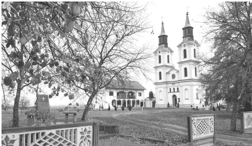
Слика 1. Комплекс цркве у Бродцу. Сасвим лијево је спомен-плоча подигнута на мјесту старе дрвене цркве.

уздржавати. 7 Нова, солидно грађена дрвена црква, покривена шиндром дужине 8 и ширине 5 метара, саграђена је 1790. године поред главног пута, недалеко од сеоског гробља. Црква је била духовно, друштвено и културно средиште становника цијеле парохије.