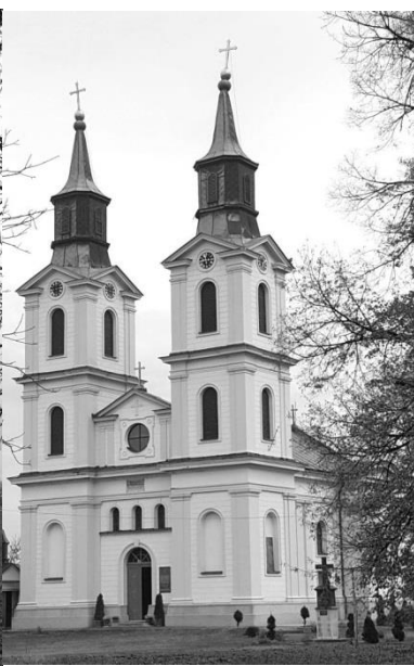
Слика 6. Улазна фасада

Једини, богато профилисан улазни портал на западном прочељу, завршен је полукружним луком са заглавним каменом. Изнад кордон вијенца су три лучно завршена мања прозора, којим се освјетљава галерија хора над припратом. У наредној висинској зони је поменута спомен-плоча Фрањи Плентају, а изнад ње богато профилисани вијенац, као дио континуираног тока кровног вијенца нижег дијела грађевине. Изнад, у пољу између кула звоника, надзид је фланкиран плитким удвојеним пиластрима, међу којима је кружни прозор у квадратном оквиру, Овај надзид, који заправо сакрива забатни зид у зони двоводног крова, завршава лијепо профилисаним античким троугаоним тимпаноном над којим је крст (Сл. 6).