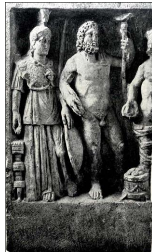
Рељеф Јупитера, Минерве и Генија

Вјероватно из истог храма потиче и пронађени рељеф Јупитера, Минерве и Генија, божанстава римског Пантеона. Фрагмент је дио божанског низа у надстијену, занатски тачно урађен, али са многобројним грешкама у цртежу. 26