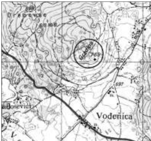
Слика 4. Локација Градине Дреновац у Вођеници