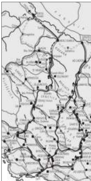
Слика 5. Прегледна карта Долабелиних цеста. 43

сојној страни планина и брда, па се влага брже сушила, а падавине су брже отицале кроз јарке грађене на стрмој страни. 42