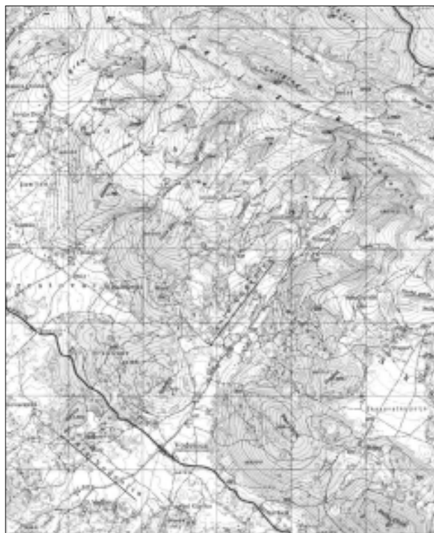
Слика 1. Топографска карта простора Вођенице (имена дијелова насеља су подвучена)

Вођеница је сеоско насеље у Општини Босански Петровац, Унско-сански кантон, Федерација Босне и Херцеговине. Већим дијелом смјештена је у високој крашкој равници Петровачког поља, с обје стране цесте Босански Петровац – Босанска Крупа, а наставља се сјевероисточно до испод Жељезника (1274 м), највишег врха Грмеча. Попречним друмом спојена је са селом Бјелај, на супротној страни Бјелајског поља. Село чине Доња и Горња Вођеница, у источном дијелу поља, које је у односу на његов западни дио богатији насељима, јер су природни услови повољнији. На блаже нагнутим падинама брда, избразданим усјецима, формиране су завлаке, као природни заклон у коме је смјештена Горња Вођеница.