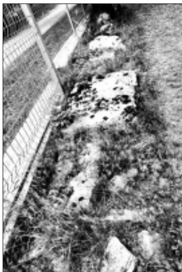
Слика 6. Стећици у облику плоча у порти Храма Успења Пресвете Богородице

"Олтар је сав откопан и дугачак је 7 метара а широк 5. Црква је без олтара била по прилици доста голема (јер није још сва откопана), а окренута је право источној страни била. Зид откопаног има до појаса, али је врло слаб и трошан, јер га је зуб времена искварио и иштетио. Црква је била на врло згодном мјесту, управо покрај потока рјечице Вођенице... Задивио сам се тим светим стварима. Тада ми нехотице на очи изиђоше све патње, које су Срби преко своје главе кроз ово пет вјекова претурили. Гледајући пред собом ове свете ствари – гледао сам као у огледалу прошлост народа свог – гледао сам пљачкање и паљење цркава и манастира српских, па сам се чисто скаменио [...] По оклопу дакле, кључу и сабљи судећи црква је изгорјела а у њој изгорјели и људи, који су је бранили." Пронађени су до тада били дискос б палаца у пречнику, а на мјесту проскомидије причесна чаша, такође од олова, уз њу копље од слоноваче, а код пријестола мали крстић "од дашчица, ваљда сребрнијех", појасне плоче (павфте), мала иконица од лима, "издубљена" са ликом анђела. На средини цркве је пронађен гвоздени кључ од цркве. У олтару људски костур и комад метала "од истопљеног звона, када је црква горјела. То су све ствари, које су нађене у откопаној црквини вођеничкој и на сву прилику да ће их се још доста наћи, јер се копање и даље наставља". 58