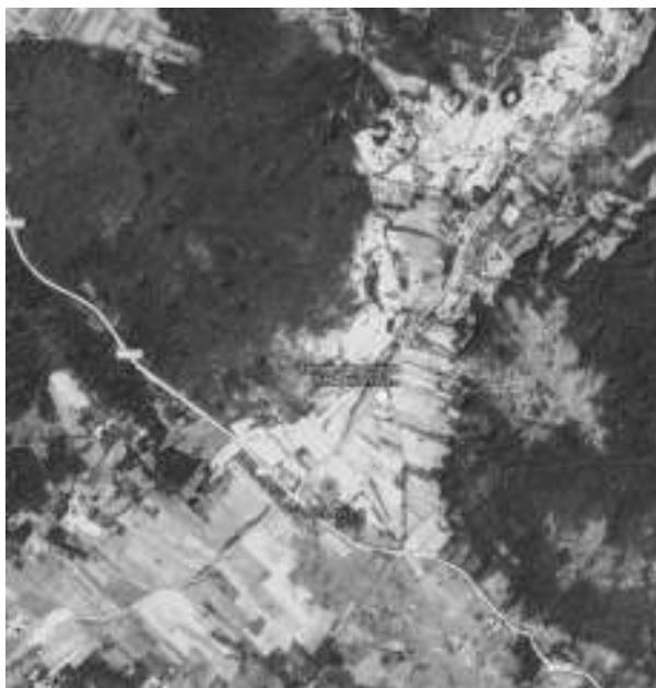
Слика 3. Географски положај Вођенице (Google map 2019)