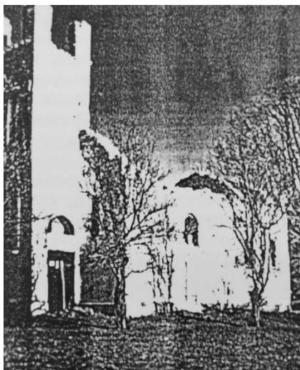
Слика 3. Стање храма прије обнове 1991. 36