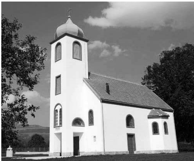
Слика 4. Садашњи изглед цркве у Вођеници