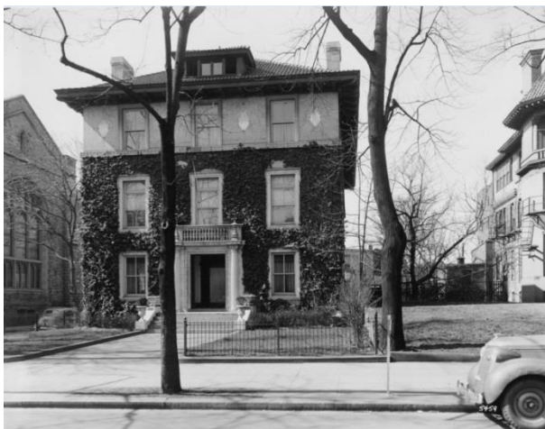
Зграда Посланства КЈ у Вашингтону