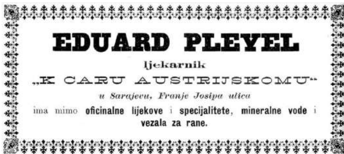
Slika 3. Reklama apoteke Eduarda Pleyela, 1884.

radu Gradskog zastupstva, moglo bi se zaključiti da je Pleyel bio aktivan zastupnik. Odlikovan je ordenima Zlatni krst za zasluge sa krunom (10. maj 1887) 19 i Vitez reda Franje. 20 Prvi orden mu je dodijeljen kao priznanje za odanu i aktivno dokazanu privrženost caru i domovini kroz dugi niz