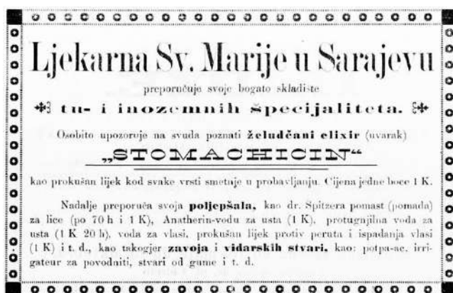
Slika 10. Reklama apoteke Sv. Marije, 1903.