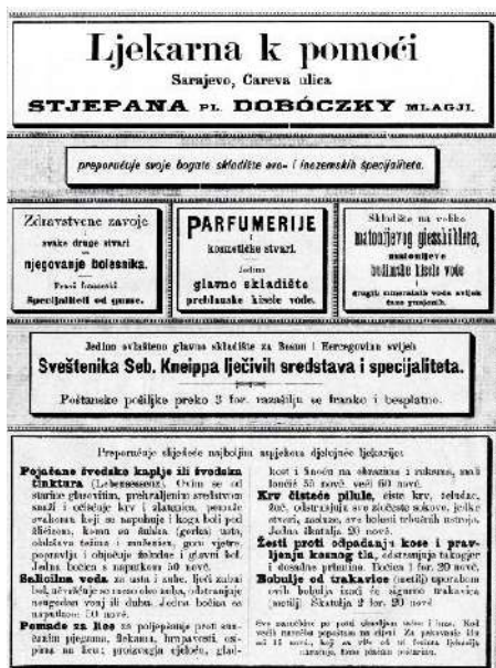
Slika 4. Reklama apoteke Doboczky mladi, 1897.

a glavno skladište za prodaju tople ilidžanske vode bilo je kod Stefana pl. Dóboczky u Sarajevu (1903). 37