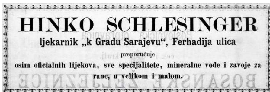
Slika 9. Reklama apoteke Hinka Schlesingera, 1893.

U apoteci u Ćemaluša ulici 165 radio je magistar Eustach Weidenhoffer 1898. i 1899. godine, 72 a sljedeće godine je bio zakupac apoteke magistra Friedricha Herziga. 73