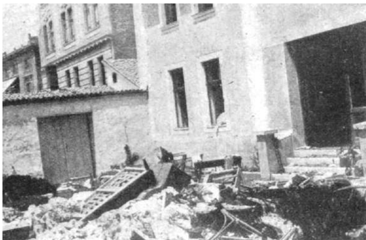
Слика 3. Избачене уништене ствари из једне српске куће

Највише су настрадали српски објекти у најужем градском центру, који је плански изграђиван по тада савременим европским архитектонско-урбанис-