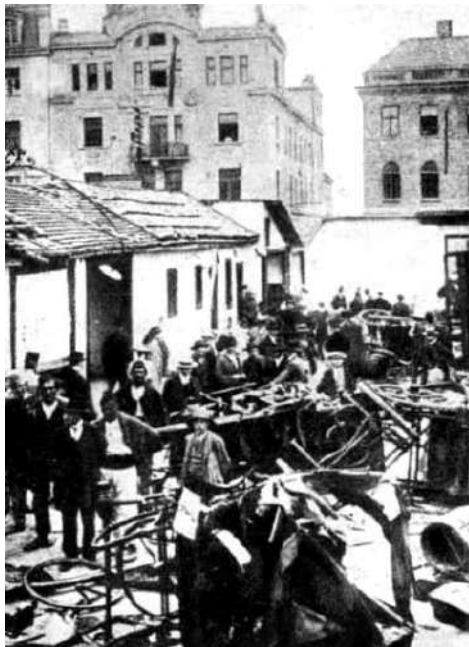
Слика 13. Уништена кола у Јефтановићевим гаражама у Темалуши, преко пута његове стамбене палате (на слици горе десно)

Дио Темалуше, између куће и гаража, затрпан је избаченим уништеним стварима, што је блокирало трамвајски саобраћај. „Темалуши изгледа од силне