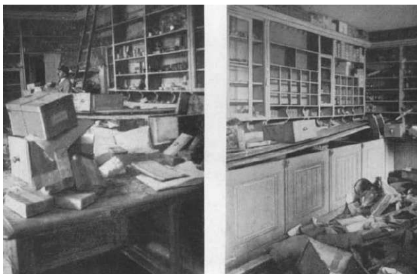
Слика 2. Опустошене и демолиране српске трговине

При томе, „руља је из многих приватних станова однела, покрала ађидаре и друге ствари од вредности”. 30