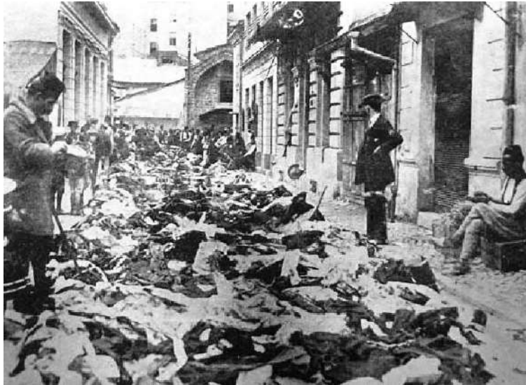
Слика 9. Улица Велики ћурчилук, прекривена робом из девастираних српских дућана