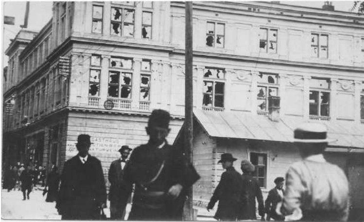
Слика 4. Демолирана зграда Српско-православне мушке и женске основне и Више дјевојачке школе

„Пошто је било већ подне, то је изведена једна чета пешадије и онда су се пљачкаши разишли кућама да ручају, да би после подне наставили свој посао са још много више енергије и разумевања.” 76