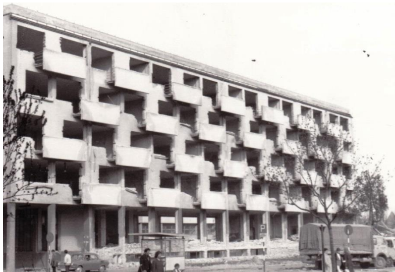
Ђачки дом „Веселин Маслеша”

Почетком школске 1960/61. дом се уселио у нову зграду, масивну четвороспратницу са бројним балкончићима и надсводима, у Улици 22. априла. 8 У дио старе зграде Дома „Веселин Маслеша” у Ул. маршала Тита 155 усељена је Виша економско-комерцијална школа, а дио зграде је и даље користио дом. Капацитет нове зграде је износио 400 мјеста, а услови за рад и становање били су изванредни. Ђаци су могли да уче у собама, јер је у њима било смјештено само пар кревета. При дому је радила кухиња са самопослуживањем. Имао је просторије за организовање забавних, спортских и културних садржаја. Клубске просторије биле су снабђевене радио-апаратима, телевизорима, разгласном станицом, литературом и спортским реквизитима. Сваке седмице одржавана су предавања о најактуелнијим политичким догађајима у земљи и иностранству. У Дому су радиле музичка, шаховска и секција за стони тенис. Од 1963. сваке суботе и недјеље су организоване игранке за питомце. У дому су од 1960, поред средњошколаца, становали и студенти Више економско-комерцијалне школе, Више пољопривредне и Више педагошке школе. То је био проблем за управу и васпитаче, јер су морали да се прилагођавају узрасту питомаца и да усклађују односе између седамнаестогодишњака и студената, од којих неки имају око четири деценије живота. Послије земљотреса у Скопљу 1963. године, 150 ученика из тог града је нашло привремени смјештај у овом дому.