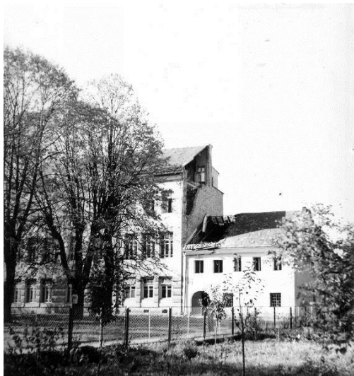
Виша економско-комерцијална школа и Бачки дом „Веселин Маслеша”

Смјештај сиромашне и дјеце под старатељством плаћао је Градски народни одбор Бањалуке. Питомци који су сами плаћали дом уплаћивали су до 1952. године мјесечно 200–300 динара, што значи да је родитељ издржавање дјетета могао платити за једну продату кокошку. У овом дому дјеца су имала добар успјех у школи јер су научили редовно учити и радити.” 6