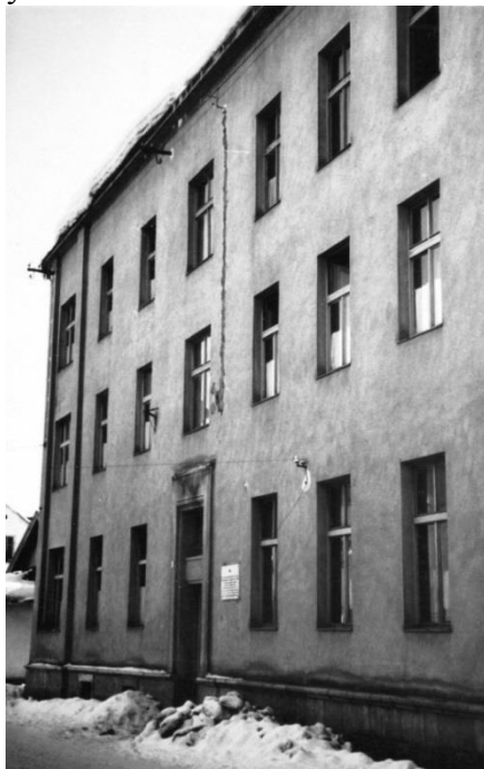
Дом ученика у привреди „Едхем Ледо Карабеговић”

Према Наредби о домовима за ученике у привреди 32 и Упутству за доношење правила за управљање домовима ученика у привреди, 33 ђачке домове ученика у привреди могла су оснивати привредна предузећа и народни одбори и морали су имати своја правила која одобравају министарства рада народних република. Према Упутству, у дом су примани ученици који су са послодавцем склопили уговор о учењу.