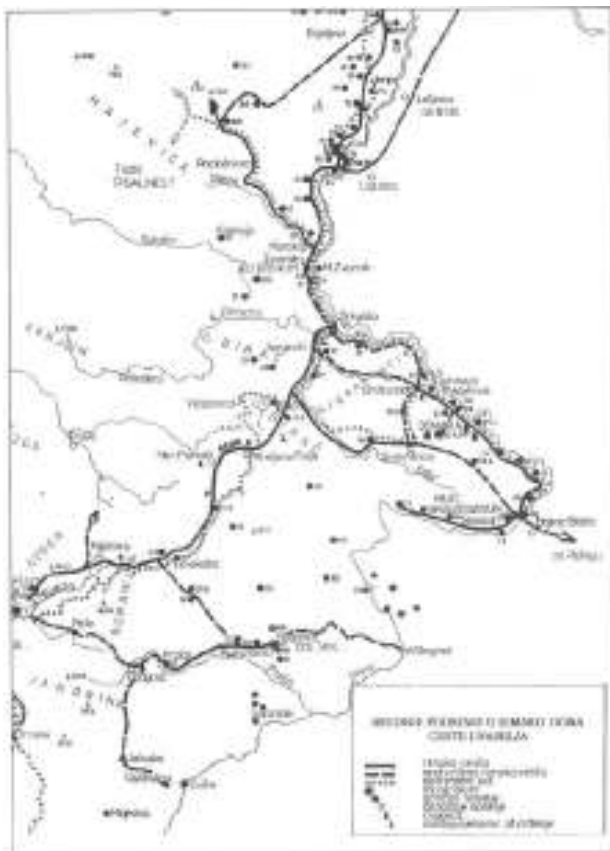
Слика 3 – Средње Подриње у римско доба: цесте и насеља