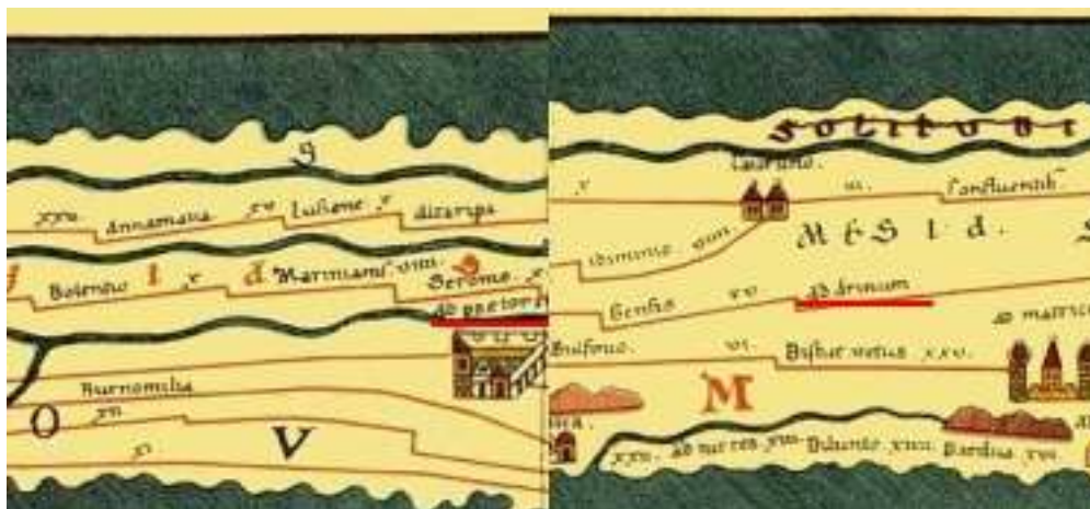
Слика 1 – Tabula Peutingeriana

Повољан положај је био разлог насељавања, па је логично да се илирско племе Диндара овдје насељава слободно живећи и привређујући. Тако је било до доласка Римљана и њихове жеље да овладају Балканом. То се десило почетком наше ере, након завршетка Батоновог устанка (од 6. до 9. године наше ере). Овај простор је постао дио римске провинције Илирије, а након тога Паноније и Далмације. Municipium Malvesiatium је био у римској провинцији Далмацији.