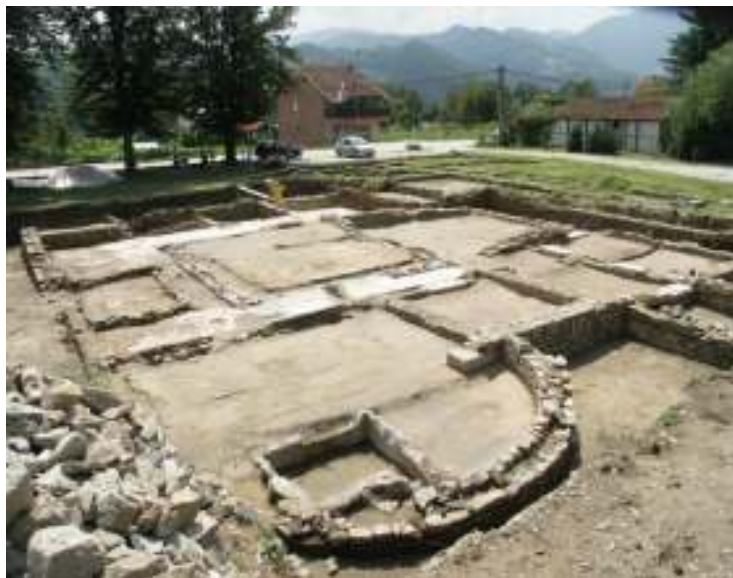
Слика 5 – Изглед локалитета Задаружни дом након кампање 2014. године

У II зони заштите дозвољени су археолошки, конзерваторски, те радови реконструкције и ревитализације простора, едукација и научноистраживачки рад уз допуштење и мишљење службе заштите.