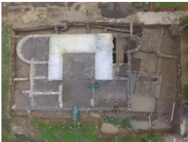
Слика 7 – Локалитет након ископавања 2016. године (фотодокументација археолошких истраживања 2016.)