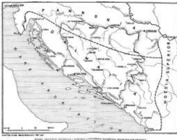
Слика 2 – Римске провинције Далмација и Панонија с означеним средиштима муниципалних градова

Municipij (lat. municipium , plural. municipia ) је у римској држави означавао град, који је имао властиту самоуправу, његови грађани су имали латинско право ( ius Latii ), тј. обавезу плаћања пореза и војне службе, али нису смјели судјеловати у политичком животу, односно бирати и бити бирани на јавне дужности. Извршну власт у муниципијима су обично вршила четири магистрата изабрана на годину дана – два duumviri и два edila , док су савјетодавну власт вршили декуриони окупљени у тијело налик на сенат. Муниципији су настајали тако што се већ постојеће неримско насеље ставило под римску власт. Каракала је 212. године свим римским поданицима дао држављанство те су муниципији изгубили своје значење. Од тог израза су, међутим, настали називи за општину у романским и другим европским језицима.