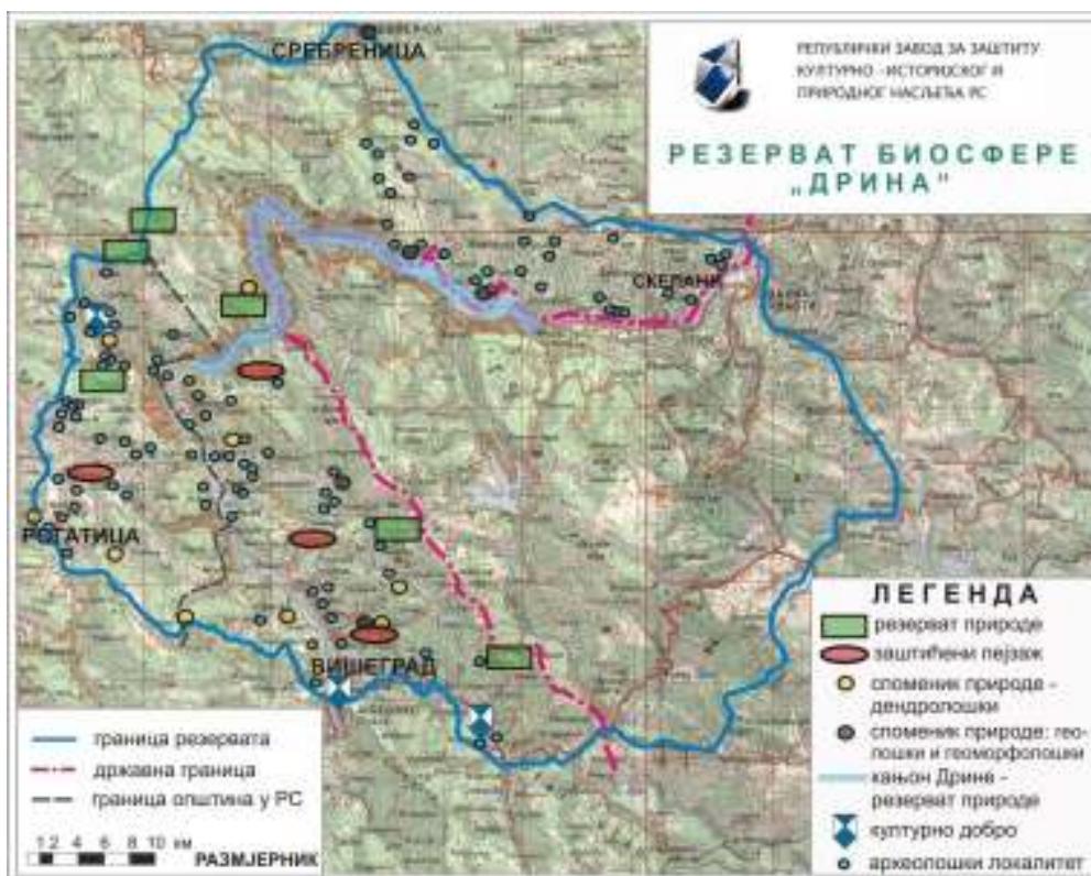
Слика 9 – Резерват биосфере Дрина