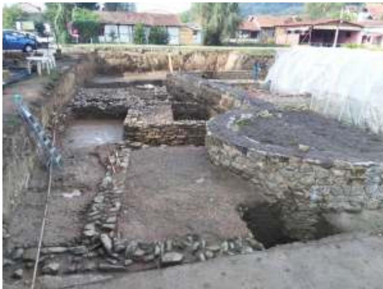
Слика 6 – Грађевина 2, кампања 2015. година (фотодокументација археолошких истраживања 2015.)

Досадашња истраживања указују да је млађа грађевина 1 имала двије грађевинске фазе, и да је највероватније напуштена и срушена, док је старија грађевина 2 имала најмање једну грађевинску фазу, коју на основу пронађеног покретног археолошког материјала датујемо у период 2. и 3. стољећа наше ере. Остаци црвене нагорјеле земље са великом количином гаражи и деформисаност фрагмената стаклених посуда указује да је грађевина страдала у пожару.