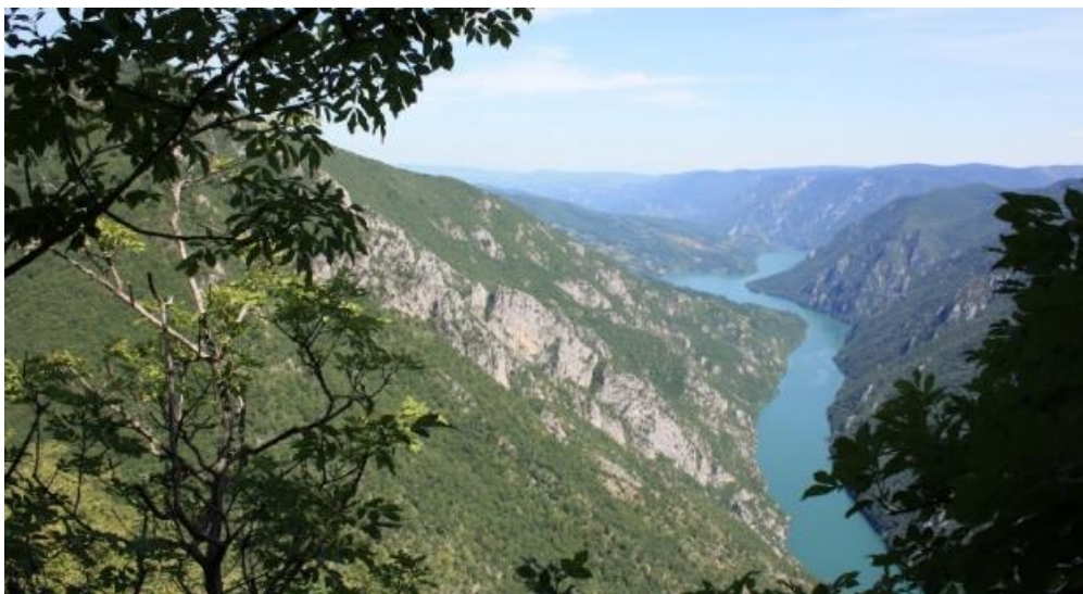
Кањон ријеке Дрине, поглед са Бијелих вода

Кад су биљне врсте у питању битно је нагласити да се у обухвату Националног парка налазе два врло вриједна стабла (Каталог највећих стабала Републике Српске, 2003), црни бор у селу Љесковик и храст цер у порти манастира Покрова Пресвете Богородице у селу Карно. Национални парк „Дрина“ је станиште угрожених животињских врста мрког медвједа, сурог орла, а посебно је потребно нагласити да се ради о изузетном станишту дивокозе. Клисурасто-кањонске долине ријеке Дрине и Црног потока, усјецајући се у карбонатне стијене у дубини већој од хиљаду метара, изграђују маркантне облике изузетне пејсажне и естетске вриједности. Велики дио кањона обрастао је појединачним или групимичним стаблима, поготово црног бора, различитих облика и форме, причвршћених жилама за голе камене литице и наднесених над сам кањон, који допуњују амбијенталне и пејсажне вриједности кањонског пејсажа.