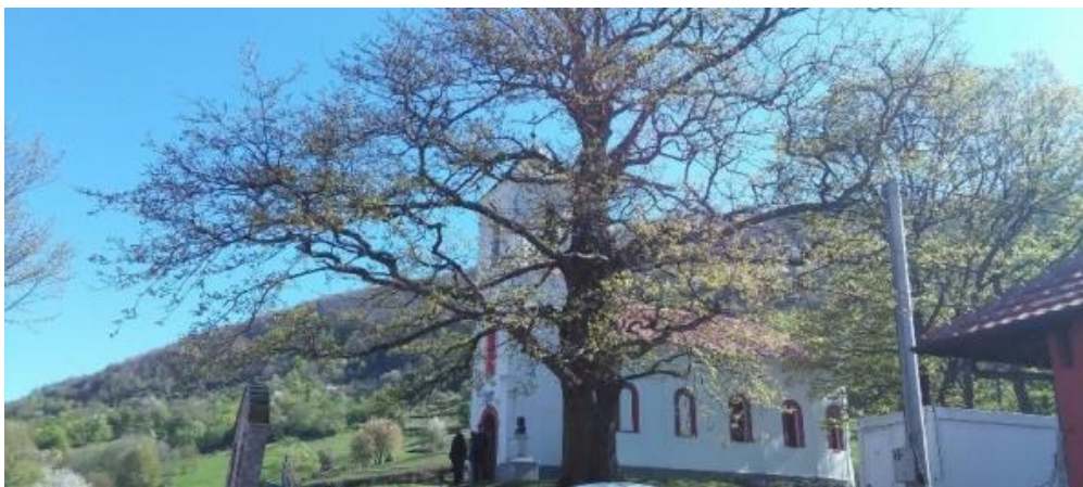
Црква Покрова Пресвете Богородице и храст цер у порти манастира

Значај проглашења националног парка не огледа се само у очувању валоризованих културно-историјских вриједности, већ носи са собом и шансу за туристички развој подручја. Иако та опција код нас није довољно развијена. Ако се погледају земље у окружењу, може се констатовати да су заштићена подручја у добром дијелу носиоци развоја региона на којима се налазе, да не кажемо цијеле државе. Заштићена подручја за собом повлаче многе услужне, производне, туристичке и друге дјелатности. Од њих не треба видјети корист због отварања неколико нових радних мјеста, већ у шанси коју пружају грађанима, који живе у и око заштићеног подручја, да у сарадњи с управљачем, пронађу начин да неке своје производе или услуге пласирају на тржиште и остваре приход. У том смислу треба заговарати да државе, односно локалне заједнице, приликом израде стратешких докумената, посвете више пажње том сегменту развоја.