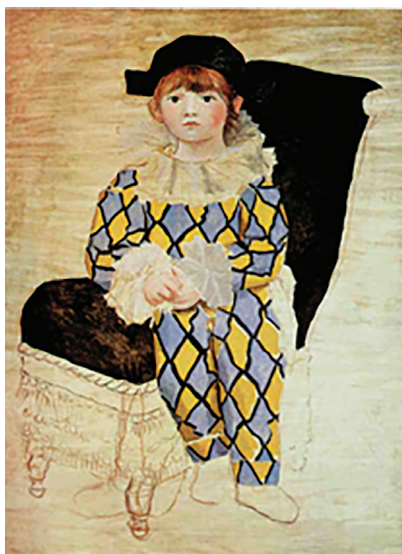
Слика 1. „Паул као харлекин“ (Walther, 2001: 50)