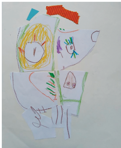
Слика 10. Никола (6), „Лице са два носа“