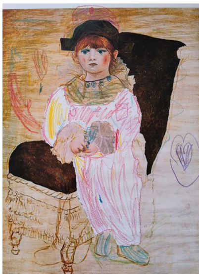
Слика 3. Тea (6), „Женски ватрогасац“