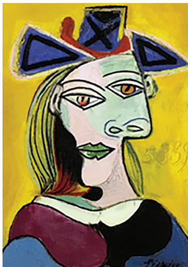
Слика 8. Жена у плавом шеширу са црвеном машином

За трећу ликовну активност одабрано је дјело „Жена у плавом шеширу са црвеном машином“ (Слика 8). Дјеци је показана репродукција дјела, те је с њима вођен разговор у којем су дјеца подстицана да кажу шта виде на дјелу и какво је лице. У практичном дијелу имали су два задатка. Први задатак био је да нацртају лице. Могли су да представе људско лице на другачији начин, не обраћајући пажњу на то како оно изгледа у стварности. Након цртања добили су задатак да исјеку своје цртеже на дијелове. Затим да помијешају дијелове свих цртежа, те да од њих створе ново лице. У првом дијелу задатка користили су се техникама из подручја цртања, оловкама у боји, фломастерима и воштаним пастелами, а у другом техником из подручја сликања, колажем.