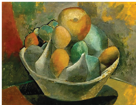
Слика 5. Здјела са воћем

За другу ликовну активност одабрано је дјело „Здјела са воћем“ (Слика 5). Дјецџ су поновљене основне информације о Пикасу, а затим им је показана репродукција. Дозвољено им је да кажу шта виде на дјелу, а затим им је пажња била усмјерена на боје и облике. Потом су објашњене основне одлике кубизма. У практичном дијелу имала су задатак да креирају своју здјелу или корпу са воћем. Прво су отискивали печате од воћа које је кориштено као шаблон, након тога су фломастерима цртали здјелу на папир. Потом су исјекли отиснуте печате и залијепили у своју корпу. Кориштене су технике из три ликовна подручја. Из подручја графике – отискивање, из подручја цртања – фломастери и из подручја сликања – колаж.