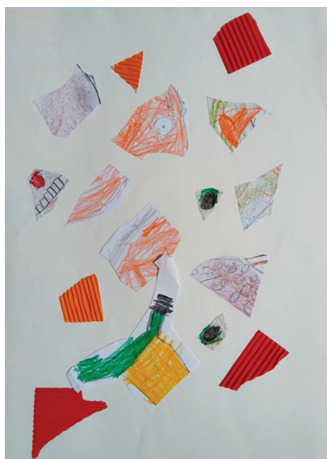
Слика 12. Константин (6), „Лице које је разбацано“