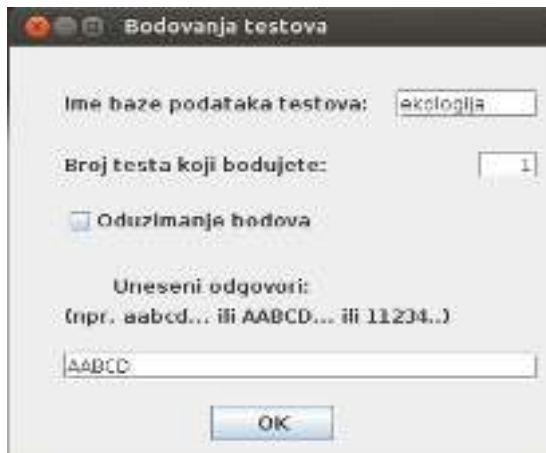
Слика 3. Форма бодовања тестова.

Кориснику је остављена и опција да изабере да ли ће при бодовању користити опцију одузимања бодова (Слика 3). У случају да је опција изабрана, вриједности бода нетачно одговорених најлакших питања се одузимају од укупног броја бодова, што чини овакво бодовање стриктнијим. Уз одговарајућу примјену ова опција ствара већу поларизацију укупних бодова тестова око границе пролазности.