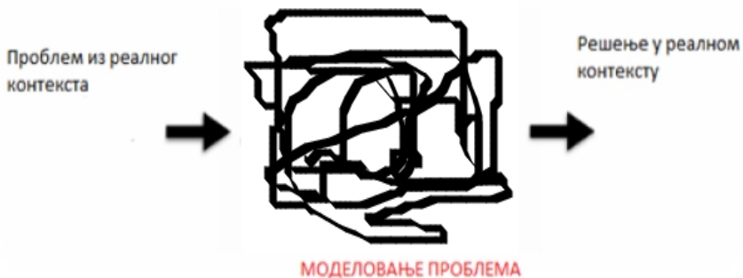
Слика 1. Симболични приказ процеса моделовања од проблема из реалног контекста до решења

У овом раду приказујемо како се ученици млађих разреда основне школе, узроста 9-10 година, кроз математичко моделовање могу упознати са математичким појмовима. На слици 1 је приказана упрошћена шема на који начин тече примена математичког моделовања у наставном процесу. Слика симболично приказује да се почиње од проблема из реалног живота или контекста, и кроз различите активности на крају се добија решење које се може применити у реалном контексту.