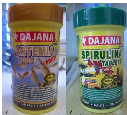
Слика 1. Комерцијално паковање јаја Artemia salina (а) и алге рода Spirulina (б)

Од 5-12. дана од почетка експеримента из посуде је помоћу пипете узимано 10-ак јединки при чему су исте одлагане у кивете и фиксиране 96% етанолом. Након тога, формирана је база фотодокумената, тако што је свака јединка фотографисана помоћу стереомикроскопа Leica EZ4D. Примјеном рачунарског програма Digimizer Image Analyzer Version 4.1, анализирани су фотографије организама, тако што су мјерени одабрани карактери, према Hontoria и Amat (1994), чија је листа приказана у Табели 1. Приказ испитиваних карактера и положај референтних тачака приказан је на Слици 2.