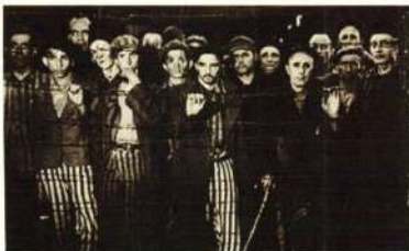
Konzentracioni logor Buchenwald