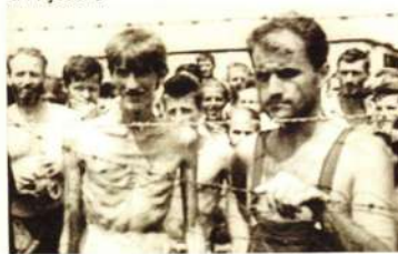
Logor za Bošnjake i Hrvate (Trnopolje)