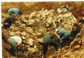
Masovne grobnice Pilica (Zvornik)

Slično kao poslije Drugog svjetskog rata, kada je svijet ostao šokiran razmjerima zločina koje su nacisti počinili na prostorima okupirane Evrope, slična reakcija je uslijedila i nakon rata u Bosni i Hercegovini. Uz pomoć nastavnika/ice uporedite ove fotografije i zaključite šta je slično, a šta drugačije u zločinima iz dva različita rata XX stoljeća.