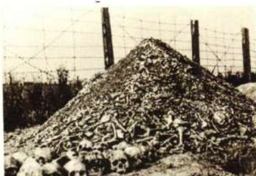
Masovne grobnice Majdanek