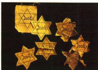
Davidove zvijezde za označavanje Jevreja

Дио треће наставне јединице у: Nastavni materijali za izučavanje opsade Sarajeva i zločina genocida počinjenog u Bosni i Hercegovini u periodu od 1992. do 1995. godine u osnovnim i srednjim školama u Kantonu Sarajevo, Sarajevo, 2018, 28.