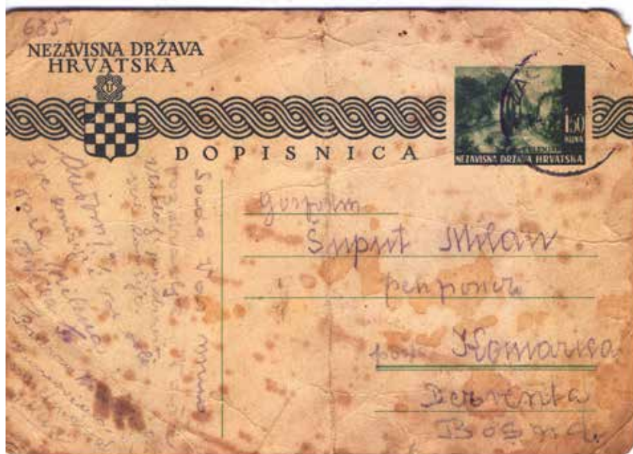
- Дописница Милану Шупуту, оцу Владином, страна 1 -