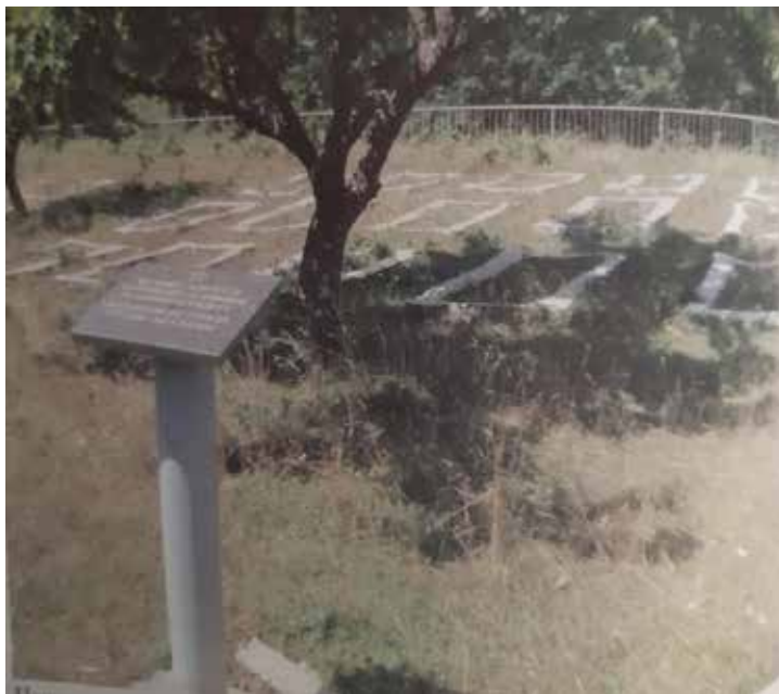
Слика бр. 1: Партизанско гробље у Шеховцима