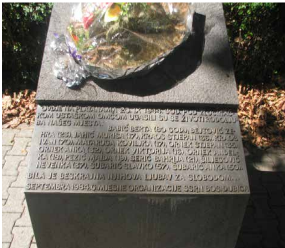
Споменик жртвама у Козарској Дубици, подигнут 1984. године, фотографисао Мирко Димић 2019. године