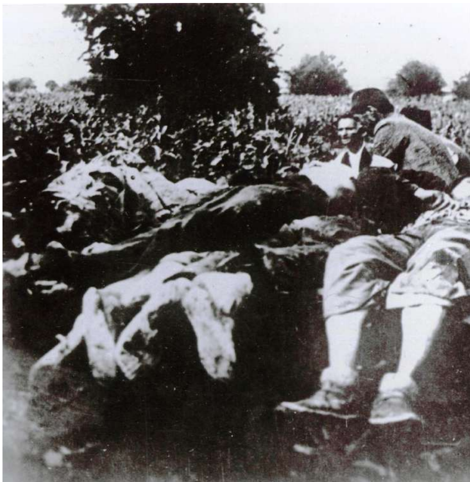
Сакупљање лешева, усташких жртава код Приједора, август 1941.

грађана Приједора и околине. На овом мјесту сахрањене су 833 жртве усташког геноцида“. 90