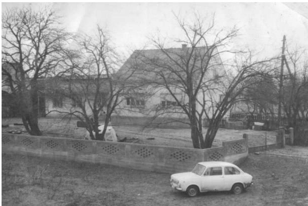
Фотографија куће Љубана Вукића, коју је направио 1960-их на локацији куће Пере Вукића.