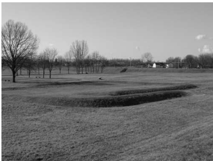
Локација прихватног логора, 20. фебруар 2020.