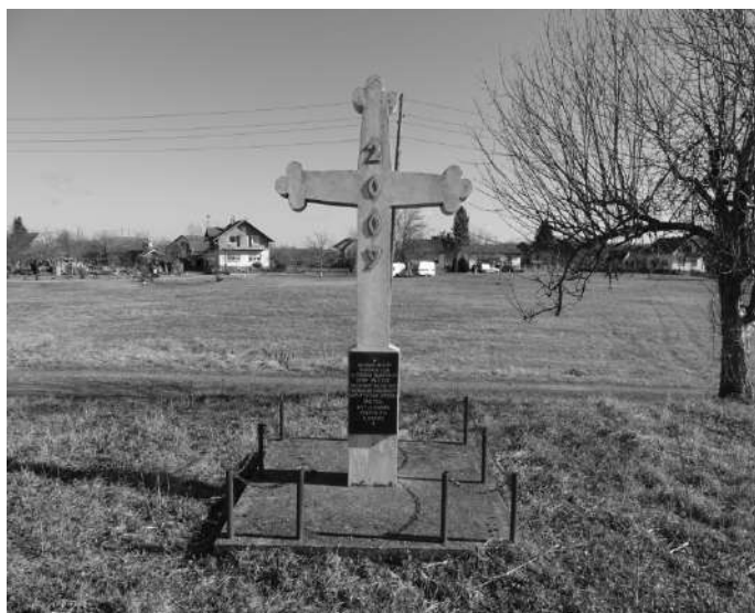
Локација Храма Вазнесења Господњег - Спасовдан у Доњој Радини, 20. фебруар 2020.