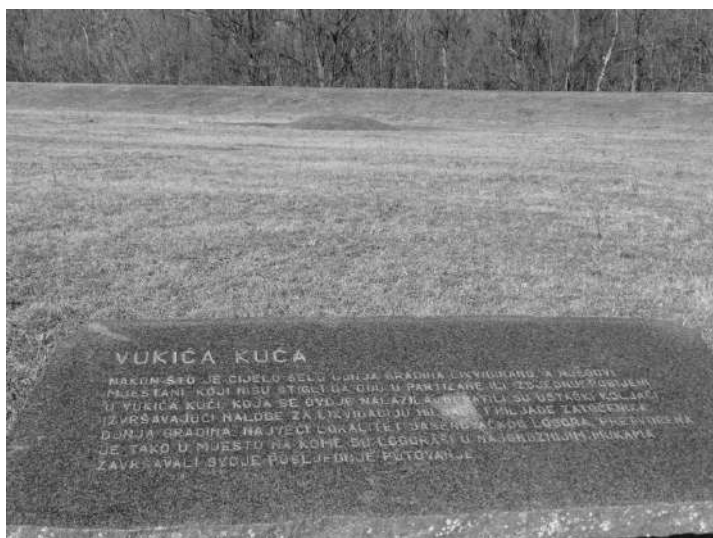
Јавна установа Спомен-подручје Доња Градина, 20. фебруар 2020, Вукића кућа.