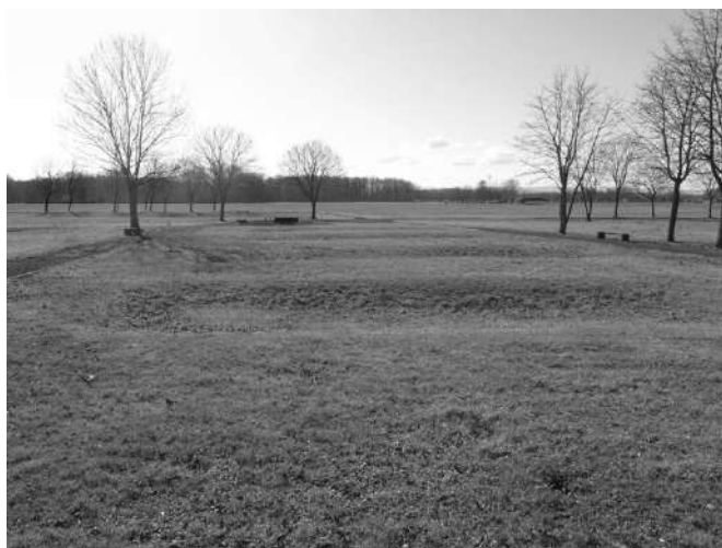
Гробно поље Тишина, четири масовне гробнице, 20. фебруар 2020.