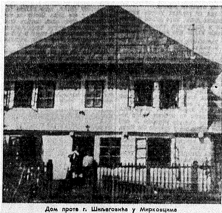
Парохијски стан у Мирковцима, фотографија из дневног листа Политика, 11. 8. 1940. године

или дрвене дашчице на којима су стајала ова три слова Ж. А. П. (Живео Анте Павелић). Гирилицу су са презиром одбацили.