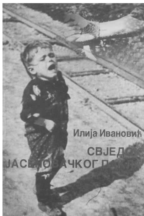
Насловнице првог и другог издања Ивановићевих мемоара, објављених 1988. и 2006. године