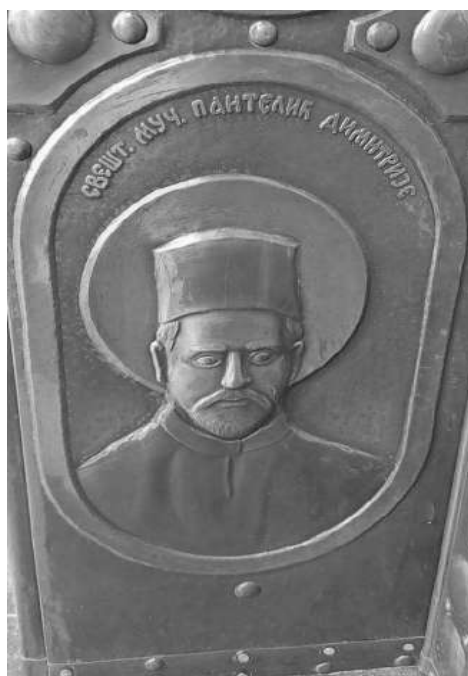
Манастир СВ. ВАСИЛИЈЕ ОСТРОШКИ, Бијељина