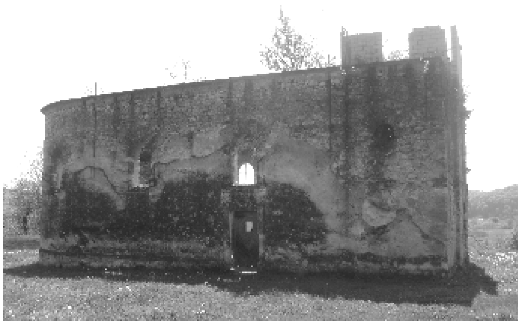
Црква Свете Петке у селу Слабиња, фотографија: Тања Тулековић, 22. април 2011. године

Глас о томе допро је и усташама у Јасеновац. Одмах је бачена сумња да са нестанком ових херцеговачких породица имају везе и домаћи Срби у Слабињи, па су усташе из Јасеновца, Дубице и Церовљана дошли у Слабињу и ту покупили око 350 Срба из Слабиње, људи, жена и деце и колико их се још тамо налазило, те су их усташе све одвели на јавно место у близини слабињске цркве и ту на једној пољани све поклали или поубијали из пушака, а затим побацали у једну јаму коју су претходно сами Срби морали себи за гроб ископати. Ово је био акт освете усташа над Србима за нестанак споменутих пет херцеговачких породица које су се населиле у Слабињу. Међутим, није никада доказано да би слабињски Срби имали било какве везе са нестанком ових пет породица“ 174 .