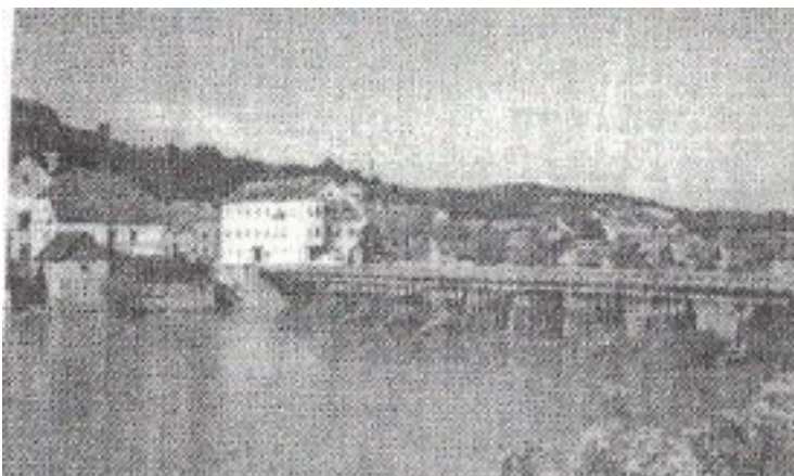
Мост на Уни између двије Костајнице, преузето из књиге Марка Ручнова, Зашто Јасеновац , сепарат број 1 33

ве који су сахрањени унатраг двије године из земље повадити и бацити у реку Уну, па затим гробље потпуно преорати тако да се не зна ни трага те влашке гамади 32 .