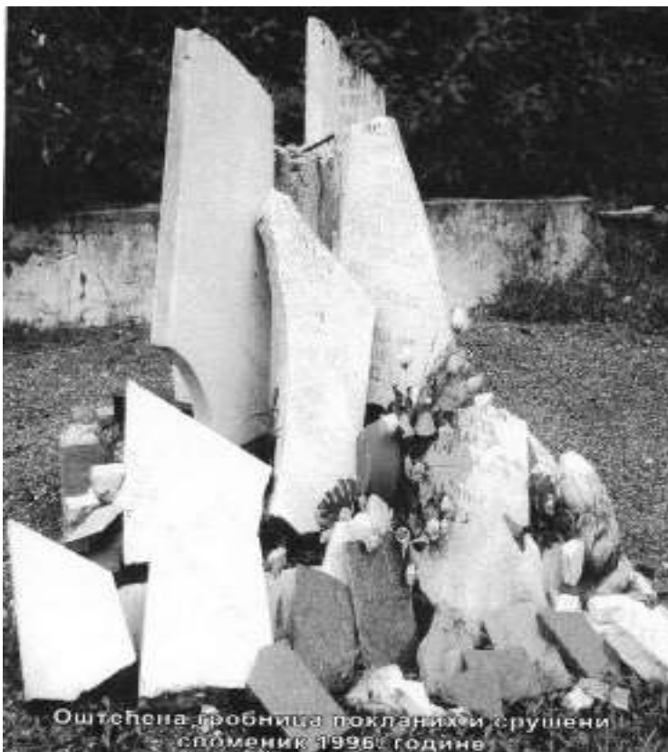
Фотографија преузета из флајера: 70. годишњица злочина у Слабињи 16/17. 12. 1943, Покољ српске дјецe и жена Слабиње код цркве Св. Пејке, Вијеће српске националне мањине опћине Хрватска Дубица, 2014.