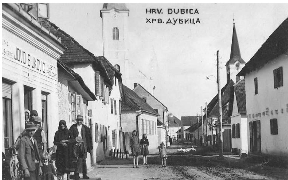
Фотографија Хрватске Дубице 39

Половином августа, власти НДХ су покренуле прву војну акцију на устанике, у литератури познатију као Румлерова офанзива. Овим се и завршава први талас усташких злочина над српским становништвом на подручју Дубице и почели они који у стварности нису ни престали до краја рата 1945. године.