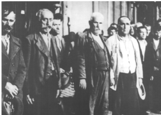
Фотографије 38 заробљених Срба са подручја Козарске Дубице, Храм Свете Тројице у Хрватској Дубици