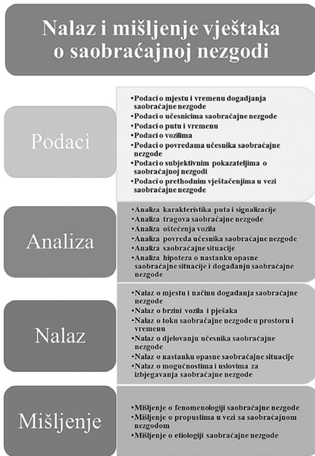
Slika 2. Sadržaj Nalaza i mišljenja vještaka o saobraćajnoj nezgodi.

Prilog za formulisanje sadržaja ekspertize saobraćajne nezgode A contribution to formulatin g the content of traffic accident expertise