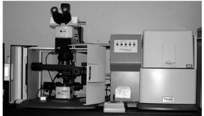
Ramanov aparat za mikro-spektrografiju

Ramanova mikro-spektroskopija može biti primijenjena tehnika analiziranja otisnutih boja na novčanicama (originalnim ili krivotvorenim, bez obzira na materijal) u svrhu dobivanja jedinstvenog spektra svake boje. Analiziranjem više boja moguće je stvoriti bazu podataka koja će pomoći u identifikaciji porijekla krivotvorina.