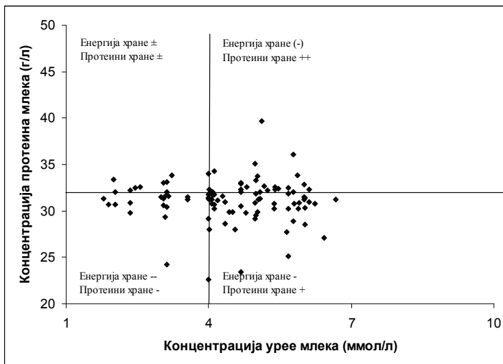
Графикон 4. Однос концентрација протеина и урее млека у појединачним узорцима млека узетим током вечерње muže 30. дана лактације