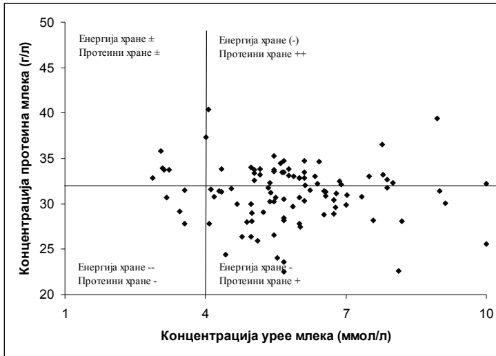
Графикон 3. Однос концентрација протеина и урее млека у појединачним узорцима млека узетим током јутарње muže 30. дана лактације