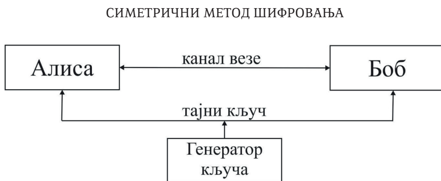
Слика 1. Структура симетричног криптосистема

Класични задатак криптографије је да трансформише неки почетни текст (отворени текст) у произвољни низ знакова који се зове криптограм. Број знакова у отвореном тексту и криптограму се може разликовати. Тајност самог алгорита кодирања 4 не може, у принципу, обезбедити безусловну сигурност криптограма, јер се претпоставља да Ева (противник) има бесконачно велике рачунарске ресурсе. Стога се данас користе отворени алгоритми. Безбедност савремених криптосистема се не заснива на тајности алгорита већ на тајности неке информације малих димензија која се назива кључ. Кључ се користи за управљање процесом кодирања и требало би да се лако може променити у било ком тренутку времена. Крајем XIX века холандски научник Керкхоф је формулисао правило по коме је сигурност кода обезбеђена ако је противнику познат целокупни систем кодирања, осим тајног кључа, тј. осим информације која управља процесом криптографске трансформације (Килин, Хорошко & Низовцев, 2007).