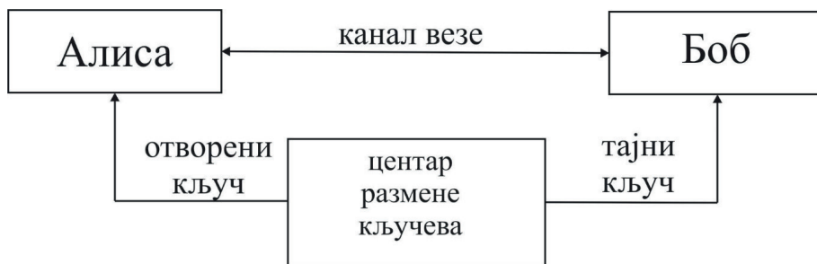
Слика 2. Структура асиметричног криптосистема

Асиметрични криптосистеми за рад користе два кључа, слика 2. Први кључ је отворен и доступан свим корисницима размене информација. Помоћу тог кључа се врши шифровање информације. Други тајни кључ поседује само прималац информације (Боб). Дешифровање информације помоћу отвореног кључа је немогуће. Такође, кључ за дешифровање није могуће одредити помоћу отвореног кључа за шифровање (Румянцев & Голубчиков, 2009).