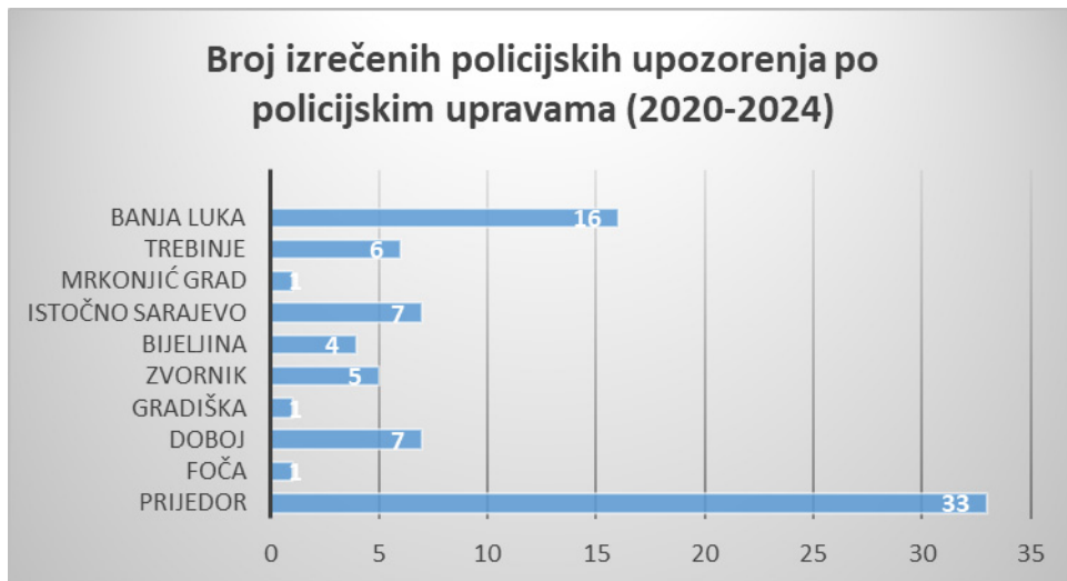
Slika 3. Broj izrečenih policijskih upozorenja po policijskim upravama (2020-2024)

Na Slici 3. Broj izrečenih policijskih upozorenja po policijskim upravama (2020-2024) prikazan je broj izrečenih policijskih upozorenja po policijskim upravama Ministarstva unutrašnjih poslova Republike Srpske u periodu od 2020. do 2024. godine (zaključno sa mjesecom februar). Evidentno je da je policijsko upozorenje izricano u svim policijskim upravama. Najviše policijskih upozorenja (njih ukupno 33) izrečeno je u Policijskoj upravi Prijedor, zatim u Policijskoj upravi Banja Luka (njih 16), te po sedam policijskih upozorenja u policijskim upravama Istočno Sarajevo i Doboj. Ovi podaci jasno ukazuju, a što je i očekivano, da se maloljetnici kao izvršioци krivičnih djela češće pojavljuju u većim gradskim sredinama.