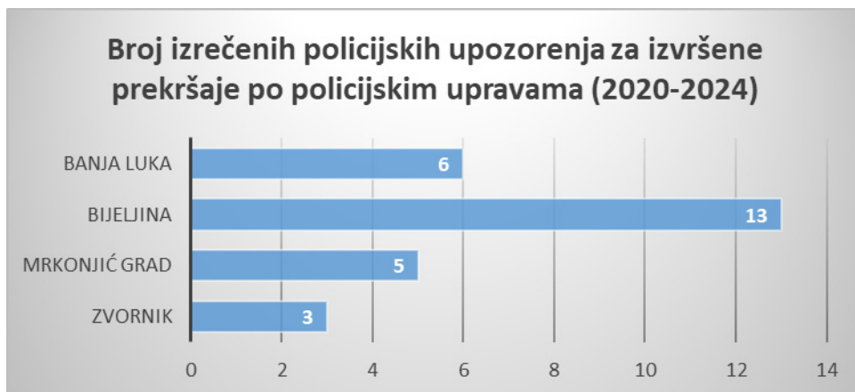
Slika 7. Broj izrečenih policijskih upozorenja za izvršene prekršaje po policijskim upravama (2020-2024)

S obzirom na to da su gotovo svi učinjeni prekršaji od strane maloljetnih lica iz oblasti javnog reda i mira u radu je analizirano učešće maloljetnika u izvršenju prekršaja protiv javnog reda i mira kojima je za te prekršaje određeno policijsko upozorenje. U poređenju sa brojem izrečenih policijskih upozorenja za izvršena krivična djela od strane maloljetnika može se zaključiti da se policijska upozorenja rjeđe izriču u oblasti prekršajnih delikata.