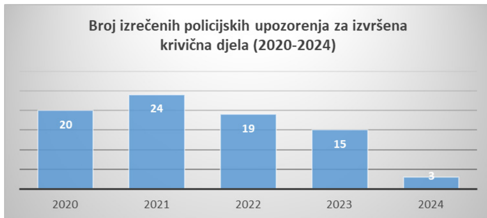
Slika 1. Broj izrečenih policijskih upozorenja za izvršena krivična djela (2020-2024)

Nadalje, prikazaće se podaci o izrečenoj mjeri policijsko upozorenje za prekršaje počinjene od strane maloljetnika u periodu od 2020. do 2024. godine (zaključno za mjesec januar i februar 2024. godine), trend izricanja ove mjere u posmatranom periodu, te u kojim policijskim upravama je mjera izricana. S obzirom na to da se maloljetnici uglavnom pojavljuju kao izvršioци prekršaja u oblasti javnog reda i mira, sva policijska upozorenja izrečena su za prekršaje iz ove oblasti u posmatranom periodu.