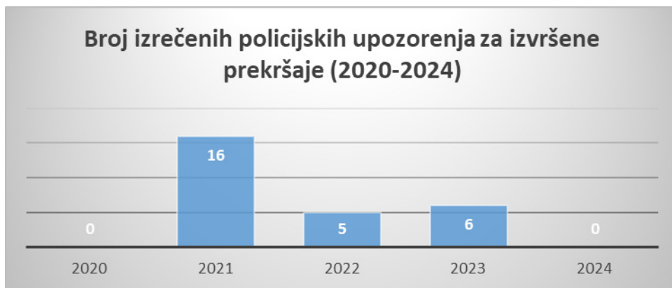
Slika 6. Broj izrečenih policijskih upozorenja za izvršene prekršaje (2020-2024)

Na Slici 6. Broj izrečenih policijskih upozorenja za izvršene prekršaje (2020-2024) prikazan je broj izrečenih policijskih upozorenja maloljetnim učiniocima prekršaja u periodu od 2020. do 2024. godine (zaključno sa mjesecom februar). Od ukupno 27 izrečenih policijskih upozorenja za izvršene prekršaje od strane maloljetnika, najviše ih je izrečeno 2021. godine (16), dok nijedno policijsko upozorenje nije izrečeno u 2020. i 2024. godini.