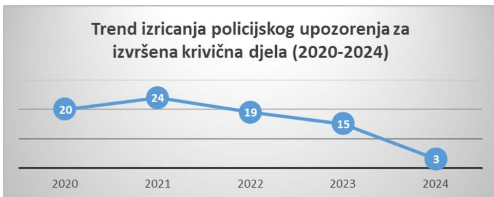
Slika 2. Trend izricanja policijskog upozorenja za izvršena krivična djela (2020-2024)

Na Slici 1. Broj izrečenih policijskih upozorenja za izvršena krivična djela (2020-2024) prikazan je broj izrečenih policijskih upozorenja maloljetnim učiniocima krivičnih djela u periodu od 2020. do 2024. godine (zaključno sa mjesecom februar). Od ukupno 81 izrečeno policijsko upozorenje, najviše ih je izrečeno 2021. godine (24), dok je najmanje izrečeno 2024. godine što je i razumljivo zbog malog broja mjeseci koji su posmatrani u navedenoj godini (samo januar i februar). Maloljetnim učiniocima krivičnih djela policijsko upozorenje je izricano za sljedeća krivična djela: Neovlaštena proizvodnja i promet opojnih droga /1, Tjelesna povreda /22, Lažno prijavljivanje /1, Utaja /3, Teška tjelesna povreda/1, Oštećenje i oduzimanje tuđe stvari /11, Krađa /19, Nasilje u porodici i porodičnoj zajednici /5, Zlostavljanje, mučenje i drugo neljudsko ponašanje /2, Iskorištavanje djece za pornografiju /1, Ugrožavanje sigurnosti /1, Teška krađa /7, Izazivanje opšte opasnosti /2, Oštećenje ili uništenje javnih uređaja /1, Mučenje i ubijanje životinja /1, Neovlašteno fotografisanje /1, Izazivanje i podsticanje nasilja i mržnje /1. Iz prethodno navedenog vidljivo je da su maloljetnici najčešće izvršavali krivično djelo Tjelesna povreda za koje je izrečeno ukupno 22 policijska upozorenja, zatim krivično djelo Krađa za koje je izrečeno 19 policijskih upozorenja, te krivično djelo Oštećenje i oduzimanje tuđe stvari za koje je izrečeno 11 policijskih upozorenja.