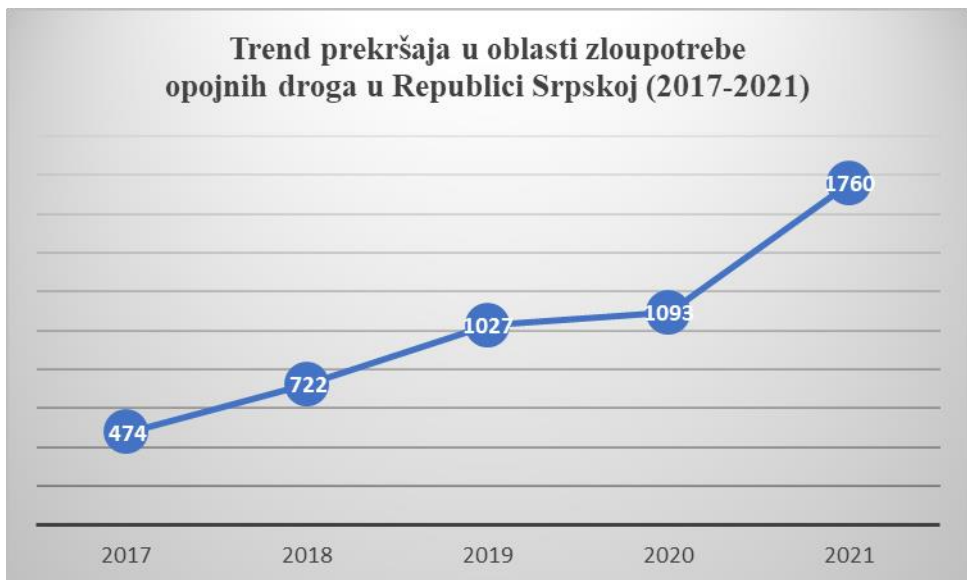
Slika 2. Trend prekršaja zloupotrebe opojnih droga u Republici Srpskoj (2017-2021)