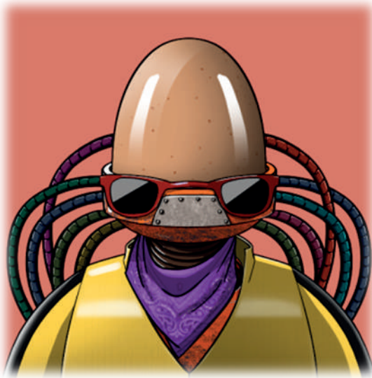
Slika 1. Eggtomaton 5 (Naziv dela: EGGTOMATON #259/ Kolekcija: Eggtomatons / Autor: EGGTOMATONSDEPLOYER / Cena: 261,03 USD)

OpenSea , koje je dostupno na Ethereum i Polygon Blockchain mrežama. OpenSea je u avgustu 2021. godine zabeležio obim trgovine od 3,4 milijarde dolara kroz 2 miliona transakcija. Tržište nameće naknadu od 2,5% prodavcima i prihvata tri valute. Podržava dve vrste prodaje: aukcije na vreme i fiksnu cenu. Maksimalna veličina datoteke je ograničena na 100 MB, dok su najdominantnije kategorije na tržištu umetnost, kolekcionarstvo, sport, metaverzum i virtuelni svetovi, kao i imena domena. Osnovan je 2018. godine i omogućava autorske naknade prema željama umetnika.