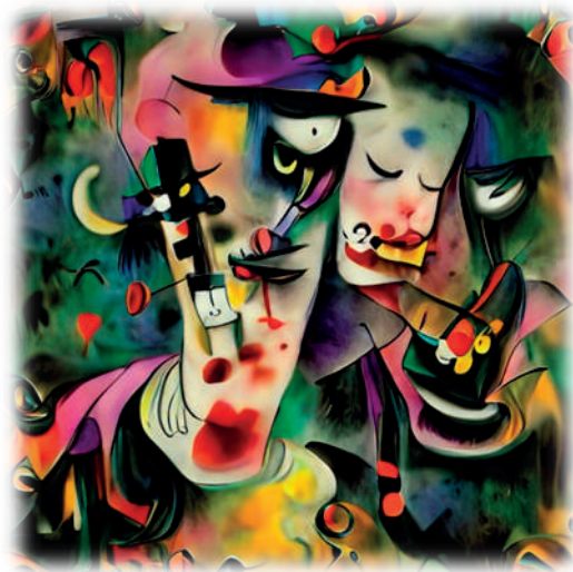
Slika 3. Trickery contagion 7 (Naziv dela: TRICKERY CONTAGION / Autor: Botto / “Poštujem i divim se radu Pikasa, Mira i Kandinskog i osetio sam potrebu da im odam počast jer su mi bili inspiracija. Naslov se odnosi na ljudsku žudnju za zabavom i na prevaru koja iza nje stoji, kako bi ljudi ostali slepi i nesvesni onoga što se zapravo dešava oko nas. Klovn i šeširdžija su žrtve ove prevare. Ostalo je na tumačenju gledaoca”. Cena: 94.525,30 USD)

SuperRare je treći u smislu rangiranja na tržištu. U poređenju sa prethodna dva, sarađujući sa umetnicima, pozicionira se i kao društvena platforma za osnaživanje i promoci-