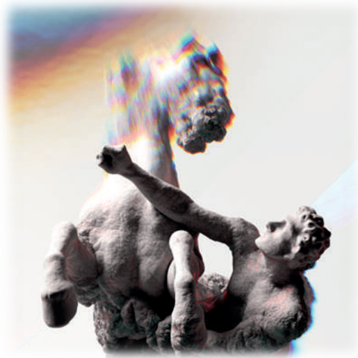
Slika 2. Beast 6 (Naziv dela: BEAST / Autor: MaxDbv / Vlasnik: StellarMirage / Cena: 2.550,00 USD )