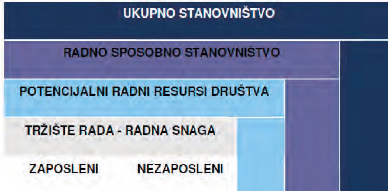
Slika: Prikaz tržišta rada u odnosu na ukupnu populaciju 9

Nezaposlenost se može razvrstati prema različitim kriterijumima. Posmatrajući strukturu tržišta rada ekonomisti razlikuju tri vrste nezaposlenosti: normalnu (1), cikličku (2) i strukturnu nezaposlenost (3).