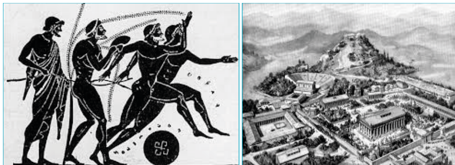
Sport nekada, danas i sutra (Grčka, Rusija, Katar)

modeli upravljanja sportskim objektima, upravljanje projektima u sportu, restrukturiranje sportskih objekata.