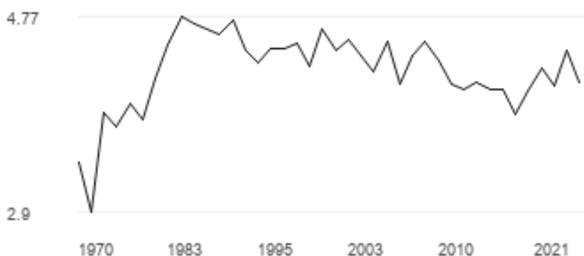
Grafikon 1. Procenat BDP-a koji Italija ulaže u obrazovanje, kroz godine

Stopa ranog napuštanja škole opada, ali i dalje ostaje iznad prosjeka EU, posebno među stanovništvom rođenim u inostranstvu, dok stopa sticanja tercijarnog obrazovanja ostaje niska. Tokom krize uzrokovane COVID-19 većina škola je uspjela brzo uvesti učenje na daljinu, ali su potrebni dodatni napori kako bi se povećao kvalitet obrazovanja. Nedavna reforma stručnog obrazovanja i obuke (VET) očekuje se da će poboljšati njegovu relevantnost na tržištu rada, posebno na lokalnom nivou. Prijelaz iz obrazovanja u radni svijet je težak, što dovodi do sve većeg odliva visoko kvalifikovanih mladih ljudi ( https://op.europa.eu/webpub/eac/education-and-training-monitor-2020/countries/italy.html#two ).